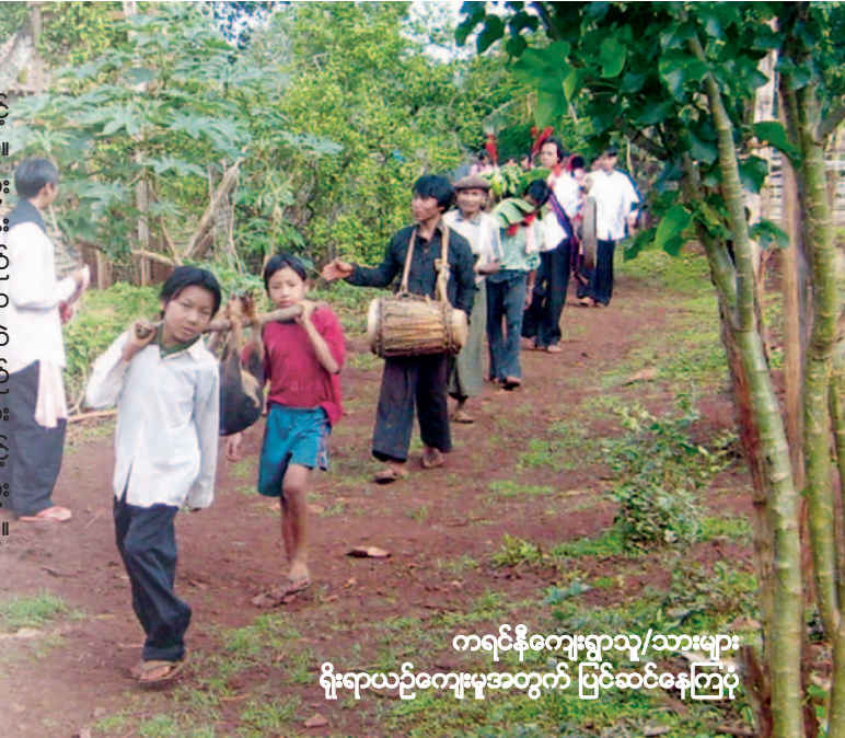
ကရင်နီကျေးရွာသူ/သားများ ရိုးရာယဉ်ကျေးမှုအတွက် ပြင်ဆင်နေကြပုံ

အတင်းအကျပ် နေရာပြောင်းရွှေ့စေရန် ဆောင်ရွက်သည့် စစ်ဆင်ရေးများကြောင့် ဌာနေတိုင်းရင်းသား ထောင်ပေါင်းများစွာမှာ ထွက်ပြေးအခြေပြုရပြီ ဖြစ်သည်။ လက်နက်ကိုင်တိုက်ပွဲများ ဆက်လက်ဖြစ်ပွားနေသည့် အတွက်ကြောင့်လည်း နေရပ်ရင်းသို့ ပြန်လာနိုင်ခြင်း မရှိကြပါ။ ဆည်တည်ဆောက်ရေးလုပ်ငန်းများကြောင့် ထိုသူများအိမ်ပြန်ရေး ပို၍ခက်ခဲစေလိမ့်မည် ဖြစ်သည်။ ၎င်းဆည်များတည်ဆောက်ရေးကြောင့် ကရင်နီလူမျိုးစု၏ မျိုးနွယ်စုတခုဖြစ်သော ယခုအခါ အရေးအတွက်အားဖြင့် ၁,၀၀၀ မျှသာ ကျန်ရှိတော့သည့် ယင်းတလဲလူမျိုးများ ဆက်လက်ရှင်သန်ရပ်တည်နိုင်ရေးအတွက်လည်း အထူးတလည် ခြိမ်းခြောက်နေပါသည်။ ၎င်းယင်းတလဲလူမျိုးတို့သည် သံလွင်နှင့် ပွန်မြစ်ကမ်း တလျှောက်ကမ်းပါးတွင် ဥယျာဉ်ခြံစိုက်ပျိုး အသက်မွေးနေကြပြီး၊ ပုံမှန်အားဖြင့် လူးနှင့် နမ်းစိုက်ပျိုးကြသည်။ ထိုသူတို့၏ ရှေးဟောင်းမြို့တော် ဘော်လခဲသည်လည်း ပွန်မြစ်၏အကြားတွင် ရှိနေရာ ပျက်စီးဆုံးရှုံးရတော့မည့် အခြေအနေ ရှိနေသည်။