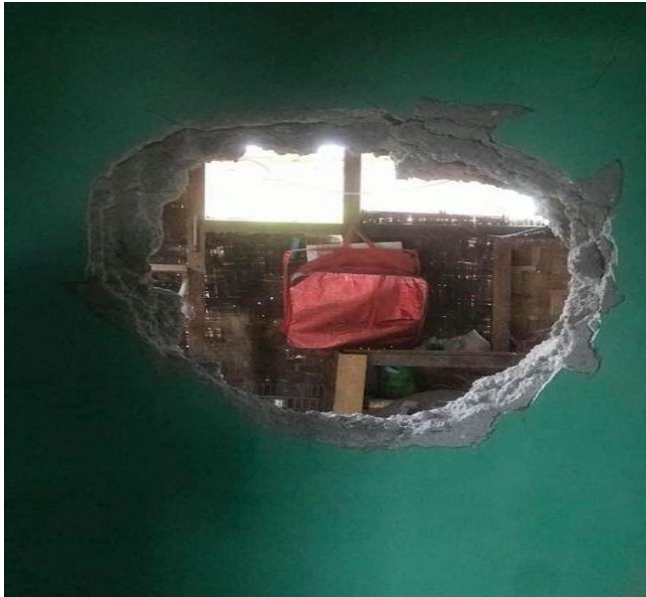
လွိုင်ကော်မြို့နယ် ဧက ၅၀၀ ရပ်ကွက်တွင် စစ်ကောင်စီမှ လက်နက်ကြီးပစ်ခတ်ခြင်းကြောင့် ပျက်စီးသွားသောအိမ် ဇွန်လ ၂၆ ရက်