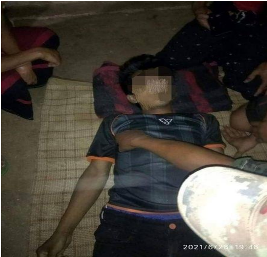
ဆိုင်ကယ်စီးလာပြီး စစ်ကောင်စီ ပစ်ခတ်သတ်ဖြတ်ခြင်းခံရသော လူငယ် တစ်ဦး၏ အလောင်း ဇွန် ၂၈ ရက်နေ့။

ဇွန်လ ၂၂ ရက်နေ့မှ ဇူလိုင် ၄ ရက်နေ့အတွင်း သတ်ဖြတ်ခံရသော လူဦးရေမှာ ၁၂ ဦးဖြစ်ပြီး ဇွန်လ ၂၈ ရက်နေ့ ညနေပိုင်းအချိန်တွင် မိုးဗြဲမြို့မှ ဖယ်ခုံမြို့သို့ ဆိုင်ကယ်စီးလာသော လူငယ် တစ်ဦးအား စစ်ကောင်စီတပ် ၁၆၇ မှ ပစ်ခတ် သတ်ဖြတ်ခဲ့သောသူလည်း ပါဝင်သည်။