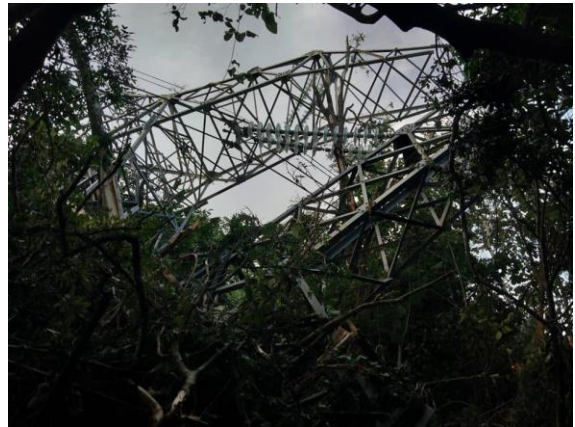
လျှပ်စစ်တာဝါတိုင်အား PDF ဖယ်ခုံ မှ ဖျက်စီး (ခေါတ်ပုံ- KT)

စစ်တပ်မြို့တော် နေပြည်တော်သို့ သွယ်တန်းထားသည့် လောပိတရေအားလျှပ်စစ်စက်ရုံ အမှတ်(၃) မဟာဓါတ်အားလိုင်း များဖြစ်သည့် လွယ်ဟွဲကျေးရွာအနီး၊ ပေါင်းလောင်းမြို့နယ်နှင့် ဖယ်ခုံမြို့နယ်အကြား တာဝါတိုင် ၂တိုင်အား ဖယ်ခုံ ပြည်သူ့ကာကွယ်ရေးတပ် (PDF) က ၂၀၂၁ ခုနှစ်၊ ဩဂုတ်လ ၁၂ ရက်နေ့တွင် ဖောက်ခွဲဖျက်ဆီးလိုက်ကြောင်း ထုတ်ပြန်ထားသည်။ ထို့နောက် ဩဂုတ်လ (၁၈)ရက်နေ့တွင် စစ်ကောင်စီတပ်အင်အား (၃၀၀)နှင့် ပီအဲန်အိုတပ်တို့သည် ပင်လောင်းမြို့နယ်မှ ဖယ်ခုံမြို့နယ်သို့ စစ်ကြောင်းထိုးလာပြီး ၎င်းတို့တပ်စွဲထားသည့် ပင်ပုံ ဘုန်းကြီးကျောင်းတွင် လက်နက်ကြီးများဖြင့် ပစ်ခတ်ခဲ့သည့်အတွက် လွယ်ဟွဲကျေးရွာရှိ လူနေအိမ်အချို့ လက်နက်ကြီးထိမှန်ပြီး ပျက်စီးခဲ့သည်။