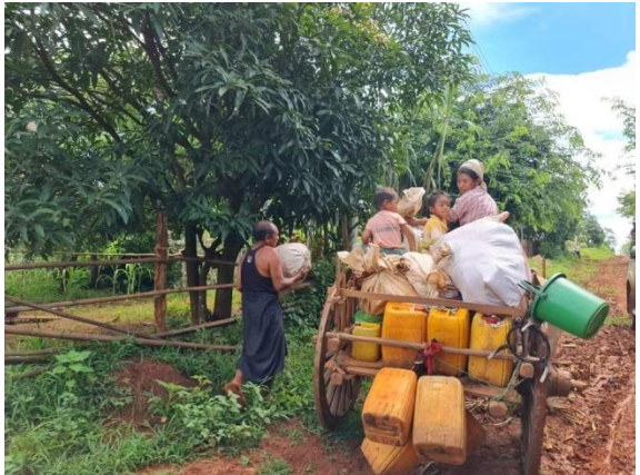
ဒေါတပေးကျေးရွာအနီး တိုက်ပွဲကြောင့် ထွက်ပြေးနေသော ရွာသားများ

ဩဂုတ်လ (၂၂) ရက်၊ နံနက် (၇:၅၀) မိနစ်အချိန်တွင် ကရင်နီပြည်နယ်၊ ဘောလခဲမြို့နှင့် မက်စလောင်းတောင်အကြား ထိုးစစ်ဆင်လာသော စစ်ကောင်စီတပ်အား KNPPတပ်နှင့်