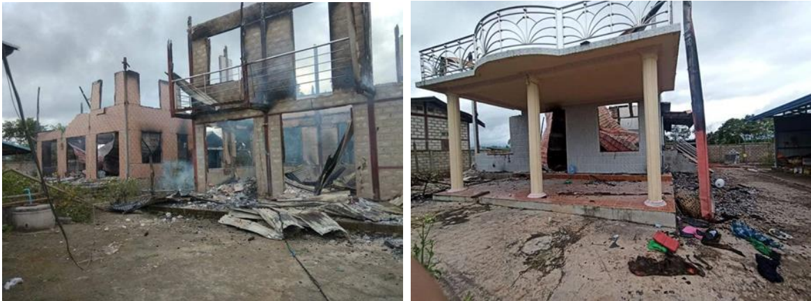
ဒီးမော့ဆိုမြို့နယ်၊ သေးဆူလဲနှင့် ကုန်းသာကျေးရွာမှ ၂၅-၂၆ ရက်နေ့တွင် စစ်ကောင်စီမှ မီးရှို့ခံလိုက်သည့်အိမ်များ

ပြည်သူ့အိုးအိမ်(၃)လုံးအား ထပ်မံမီးရှို့ခဲ့သည်။ တိုက်ပွဲဖြစ်ပွားခဲ့သောနေရာတွင် စစ်ကောင်စီမှ နေအိမ် (၃၅) လုံး မီးရှို့ဖျက်ဆီးခဲ့ပြီး (၁၅) လုံး သည် လက်နက်ကြီး ပစ်ခတ်မှုများကြောင့် ထိမှန်ပျက်စီးခဲ့ကြောင်း KNDF မှ ထုတ်ပြန်သည်။ တိုက်ပွဲကြောင့် ဒီးမော့ဆိုမြို့နယ် ကုန်းသာ၊ ကျောက်ဆည်ကန်၊ သေးဆူလဲ၊ ဒေါင်ခါးစသည့် ရွာများမှ ဒေသခံများနှင့် အနီးနားတဝိုက်ရှိ ဝိကျေးရွာပေါင်း (၁၀)ရွာမှ ဒေသခံ တစ်သောင်းနီးပါး ထွက်ပြေးတိန်းရှောင် နေကြရသည်။