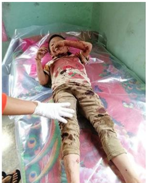
စကစ၏ လက်နက်ကြီးပစ်ခတ်မှုကြောင့် မယ်တော်ဘုရားရှိခိုးကျောင်း ထိခိုက်ပျက်စီး ဖရူဆို