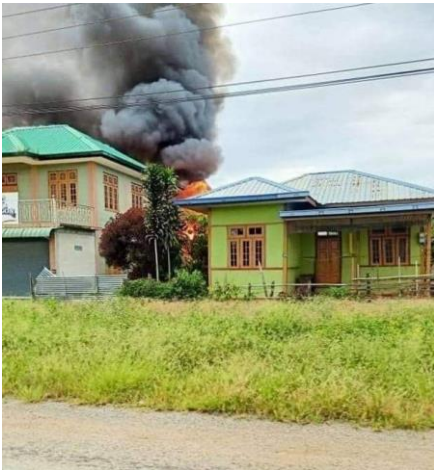
စစ်ကောင်စီမှ မီးရှို့ဖျက်ဆီးသည့် အိမ် ဒီမော့ဆို

အောက်တိုဘာလ(၁၄)ရက်နေ့၊ ဒီမော့ဆိုမြို့နယ်၊ ဒေါခလိုက်လင်းရွာမှ ပြည်သူ့အိမ်နှစ်လုံး မီးရှို့ဖျက်ဆီးခံခဲ့ရသည်။ တစ်ရက်တည်းတွင်ပင် ဒီမော့ဆိုမြို့နယ်၊ (၆)မိုင်၊ ဘက်သလင် နှင့် ဝမ်လထွား ကျေးရွာဘက်သို့ စစ်ကြောင်းထိုးလာသော စစ်ကောင်စီတပ်များကို KNDF မှ မိုင်းဆွဲတိုက်ခိုက်ခဲ့ရာ စစ်ကောင်စီဘက်မှ (၃)ဦး သေဆုံးကာ (၄) ဦးထက်မနည်း ထိခိုက်ဒဏ်ရာရရှိခဲ့သည်။ ထို့အပြင် ဖားဆောင်းမြို့နယ်၊ နန်းမကုနှင့် ပန်ပုကျေးရွာအကြားတွင် စစ်ကောင်စီတပ်နှင့် KNPPတပ်တို့ တိုက်ပွဲ ဖြစ်ပွားခဲ့သည်။