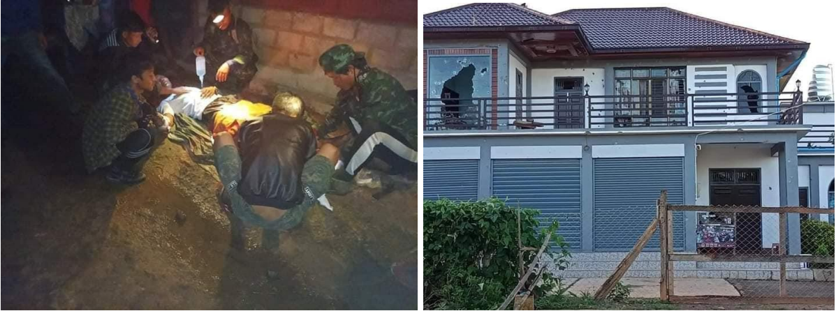
စစ်ကောင်စီတပ်များ ထောင်ထားသော မိုင်းနင်းမိပြီး ဒဏ်ရာရရှိသွားသည့် သေးဆူလဲ ရွာသား၊ လက်နက်ကြီးကျည် ကျပေါက်ကွဲခြင်းကြောင့် ပျက်စီးသွားသော ကုန်းသာ ကျေးရွာမှ နေအိမ်

စက်တင်ဘာလ (၂၉) ရက်နေ့၊ ဒီးမော့ဆိုမြို့နယ် သေးဆူလဲကျေးရွာရှိ စစ်ဘေးရှောင်ပြည်သူ (၁) ဦးသည် နေအိမ်သို့ ရိက္ခာသယ်ယူရန် ပြန်လာစဉ် စစ်ကောင်စီတပ်များ ထောင်ထားသော မိုင်းနင်းမိပြီး ပြင်းထန်စွာ ဒဏ်ရာရရှိခဲ့သည်။