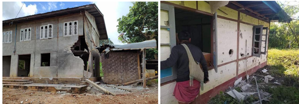
စကစ လက်နက်ကြီးထိမှန်ပျက်စီးသွားသော ပြည်သူ့အိမ် ဖယ်ခုံမြို့နယ် စကစ လက်နက်ကြီးထိမှန်ပျက်စီးသွားသော ရွှေပြည်အေးဆေးခန်း

နိုဝင်ဘာလ (၁)ရက်နေ့၊ ဒီးမော့ဆိုမြို့နယ်၊ ရွှေယောက်ရပ်ကွက်ရှိ ကင်းပုန်းချထားသော စစ်ကောင်စီ တပ်ဖွဲ့များက လက်နက်ကြီးများဖြင့် အကြောင်းမဲ့ပစ်ခတ်မှုကြောင့် ဒီးမော့ဆိုမြို့နယ်၊ ဒေါင်ခါး ရပ်ကွက်(၂)ရှိ ပြည်သူပိုင် ဂိုဒေါင်တစ်လုံးနှင့် နေအိမ်(၃)လုံး ထပ်မံပျက်ဆီးခဲ့ရသည်။