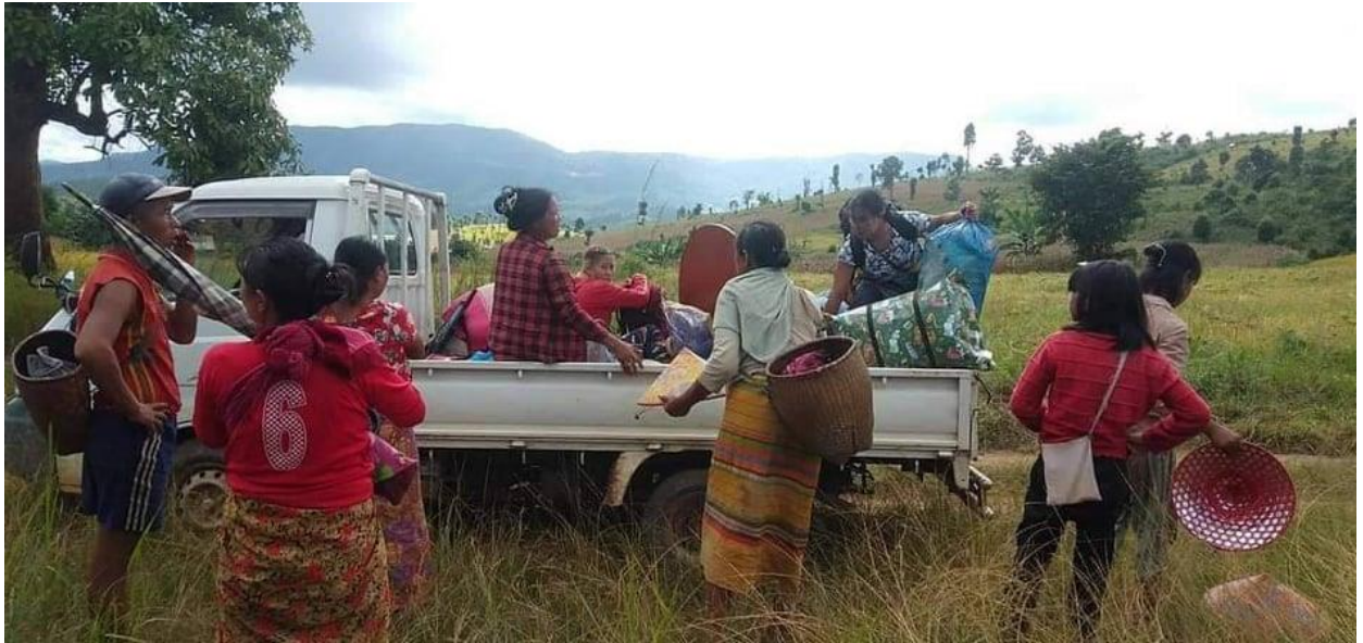
သီးနှံရိတ်သိမ်းနေစဉ် စစ်ကောင်စီတပ် ထိုးဆင်စစ်ဆင်လာသည့်အတွက် ထွက်ပြေးတိမ်းရှောင်နေသော ပြည်သူများ

စစ်ကောင်စီတပ်မှ (၅)ဦး သေဆုံးကာ၊ KNDF မှ ရဲဘော် (၂)ဦးနှင့် PDF မှ ရဲဘော် (၂) ဦး ဒဏ်ရာ ရရှိခဲ့သည်။ ထို့အပြင် ဖယ်ခုံမြို့နယ် အနောက်မြောက်ဖက်ရှိ လွယ်လုံ၊ လွယ်ဟွဲကျေးရွာမှ ဒေသခံ တောင်သူများ သီးနှံရိတ်သိမ်းနေစဉ် စစ်ကောင်စီတပ်မှ အင်အား ၅၀၀ ခန့်ဖြင့် ထိုးစစ် ဆင်လာသည့် အတွက် ထွက်ပြေးတိမ်းရှောင်ခဲ့ရသည်။