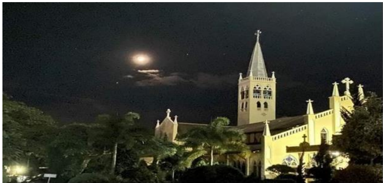
ရဲနှင့် စစ်ကောင်စီတို့မှ ဝင်ရောက်ရှာဖွေခဲ့သော ခရစ္စတူး ဘုရားကျောင်း

နိုဝင်ဘာလ ၂၂ ရက်နေ့၊ လွိုင်ကော်မြို့၊ နောင်ယားရပ်ကွက်ရှိ ခရစ္စတူးဘုရင်ဘုရားကျောင်းအတွင်း ရဲနှင့် စစ်သားတို့မှ အင်အားအများအပြားဖြင့် ဝင်ရောက်ရှာဖွေခဲ့ပြီး ကျောင်းဝင်းထဲရှိ ဂရုဏာဆေးခန်းမှ စစ်တပ်မှ စေတနာ့ဝန်ထမ်း ဆရာမ (၁၈)ဦးအား ဖမ်းဆီးခေါ်ဆောင်သွားခဲ့သည်။ သည့်အပြင် ဆေးခန်းမှ အရေးကြီးလူနာများနှင့် ကိုဗစ်လူနာများကိုလည်း လွိုင်ကော်ပြည်သူ့ဆေးရုံကြီးသို့ ရွှေ့ပြောင်းသွားခဲ့ပြီးသည့်နောက် ဂရုဏာဆေးခန်းအား ပိတ်သိမ်းလိုက်သည်။ ဖမ်းဆီးခံထားရသော ဂရုဏာဆေးခန်းမှ စေတနာ့ဝန်ထမ်း ဆရာမ (၁၈)ဦးအား နိုဝင်ဘာလ ၂၃ ရက်နေ့ ညနေ ၆ နာရီကျော်အချိန်တွင် ပြန်လည်လွှတ်ပေးခဲ့သည်။