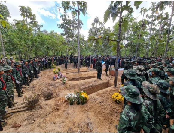
တိုက်ပွဲအတွင်း ကျဆုံးသွားသည့် KNDF ရဲဘော် (၄)ဦး၏ နောက်ဆုံးမြင်ကွင်း

နိုဝင်ဘာလ ၂၅ ရက်နေ့၊ ရှားတောမြို့နယ် ပွန်ချောင်းအနီးတွင် စစ်ကောင်စီ၏ ရှေ့တန်းတပ်စခန်းအား ကရင်နီ တပ်မတော်(KA)၊ KNDF ပူးပေါင်းတပ်ဖွဲ့တို့မှ (၄)ကြိမ် တိုက်ခိုက်ခဲ့ပြီး ၂၆ ရက်နေ့တွင် (၁)ကြိမ် ထပ်မံတိုက်ပွဲ ဖြစ်ပွားခဲ့သည်။ တိုက်ပွဲတွင် စစ်ကောင်စီဖက်မှ (၃)ဦး ထိခိုက်ဒဏ်ရာရရှိခဲ့သည်။ တိုက်ပွဲဖြစ်ပွားရာ အနီးနားတွင် ရှိသော ကျေးရွာ (၃)ရွာက အိမ်ခြေ (၃၀၉) အိမ် ထွက်ပြေးတိမ်းရှောင် နေကြရသည်။