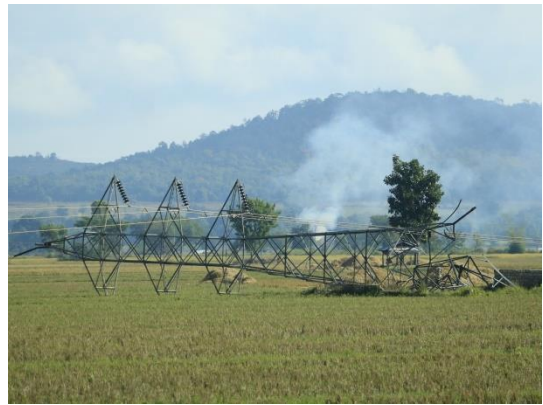
ဖျက်ဆီးခံရသည့် တာဝါတိုင်

နိုဝင်ဘာလ ၂၅ ရက်နေ့၊ လွိုင်ကော်မြို့နယ် ဆော်ဒီးဒေါနှင့် ဒေါလိုရေးကျေးရွာအကြားရှိ လျှပ်စစ်ခါတ်အားပေး တာဝါတိုင်ကြီး နှစ်ခုအား ဖျက်ဆီးခံလိုက်ရသည်။ ဖျက်ဆီးခံလိုက်ရသော တာဝါတိုင်နှစ်ခုသည် လောပီတ အမှတ်(၁)ခါတ်အားပေးစစ်ရုံမှ နေပြည်တော်၊ ရန်ကုန်၊ မန္တလေးစသည့် မြို့ကြီးများသို့ ခါတ်အားပေးပို့နေသော တာဝါတိုင်ဖြစ်သည်။