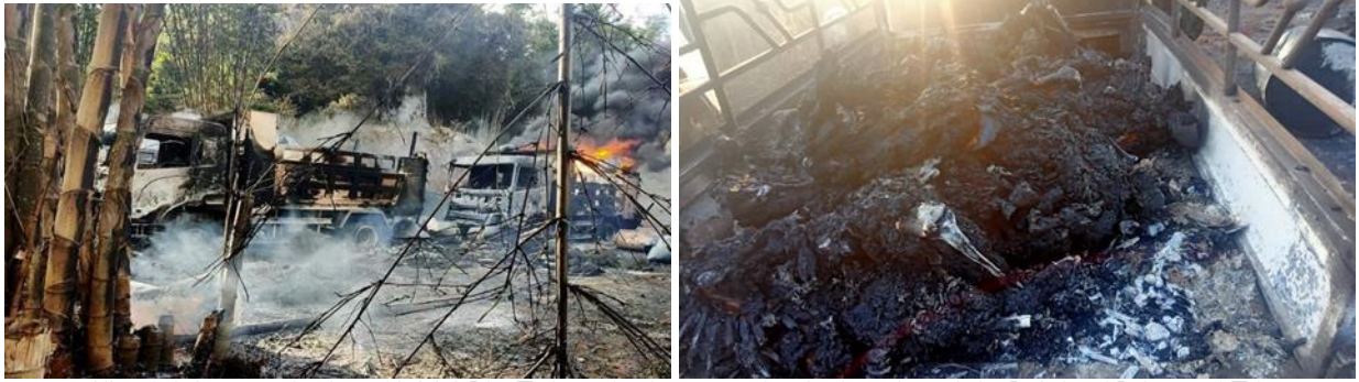
ဖရူဆိုမြို့နယ်၊ မိုဆိုကျေးရွာအနီး စစ်ကောင်စီ၏ မီးရှို့ခြင်းကြောင့် လောင်ကျွမ်းနေသော မော်တော်ယာဉ်များနှင့် အစုလိုက်အပြုံလိုက်သတ်ဖြတ်ခံရသူ ရုပ်ကြွင်းများ