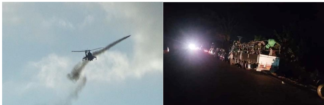
စကစမှ လွိုင်ကော်မြို့နှင့် ဒီးမော့ဆိုမြို့အား လေယာဉ်ဖြင့် ဖုံးကြဲ လွိုင်ကော်နှင့် ဒီးမော့ဆိုမြို့မှ ထွက်ပြေးလာသူများအား တောင်ကြီးသို့သွားရာ လမ်းတွင်ပိတ်မိ

ကရင်နီပြည်နယ် လွိုင်ကော်မြို့ပေါ်တွင် တိုက်ပွဲများကြောင့် ဒေသခံများ နေရပ်စွန့်ခွာ တိမ်းရှောင်သွားပြီး နောက် စစ်ကောင်စီ တပ်ဖွဲ့ဝင်များအပါအဝင် လူတချို့သည် နေအိမ်များနှင့် ဆိုင်ခန်းများအား ဖျက်ဆီး ဖောက်ထွင်းကာ ခိုးယူမှုများ ပြုလုပ်လျက်ရှိသည့်အတွက် စစ်ဘေးရှောင်ပြည်သူများသည် တပူပေါ်နှစ်ပူဆင့် ဖြစ်နေကြရသည်။ လေကြောင်းတိုက်ခိုက်မှုများကြောင့် လွိုင်ကော်မြို့မှ ဒေသခံ ၂၀၀၀၀ (သုံးပုံနှစ်ပုံ) ကျော်သည် ထွက်ပြေးနေကြရပြီး ဒီးမော့ဆိုမြို့မှ ပြည်သူများသည် လွိုင်ကော်မြို့သို့ ယခင်ကတည်း ထွက်ပြေးလာခဲ့ကြခြင်း ဖြစ်သည်။ ယခုအချိန်တွင် နောက်တကြိမ်မြို့ကိုစွန့်ခွာပြီး ထပ်မံထွက်ပြေးနေရသည်။