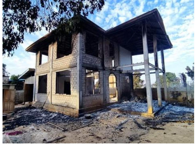
လွိုင်ကော်မြို့၊ မိုင်းလုံးရပ်ကွက်ရှိ ပြည်သူ့နေအိမ်များအား စကစမှ ဒီးဂျီပျက်စီး

ဇန်နဝါရီလ (၁၂) ရက်နေ့၊ စစ်ကောင်စီတပ်၏ တိုက်လေယာဉ်ဖြင့် ဗုံးကြဲတိုက်ခိုက်မှုကြောင့် လွိုင်ကော်မြို့ ဒေါ်ခွေရပ်ကွက်ရှိ ကက်သလစ်ဘုရားရှိခိုးကျောင်းအား ထိမှန်ကာ ပျက်စီးခဲ့သည်။