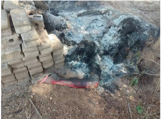
စကစမီးရှို့သတ်ဖြတ်ခဲ့သည့် ပြည်သူ့နစ်ဦး ပကြ

ဖေဖော်ဝါရီလ(၇)ရက်နေ့၊ KNDF B-02, B-03, B-11 နှင့် ဖယ်ခုံအရှေ့ဘက်ခြမ်း PDF ပူးပေါင်းတပ်ဖွဲ့နှင့် စစ်ကောင်စီတပ်တို့သည် လျှင်ကော်မြို့၊ ကုန်းသာကျေးရွာအနီးတွင် တိုက်ပွဲဖြစ်ပွားခဲ့ရာ စစ်ကောင်စီဘက်မှ (၉)ဦးထက်မနည်း ကျဆုံးကြောင်း KNDF B3မှ ထုတ်ပြန်ထားပါသည်။