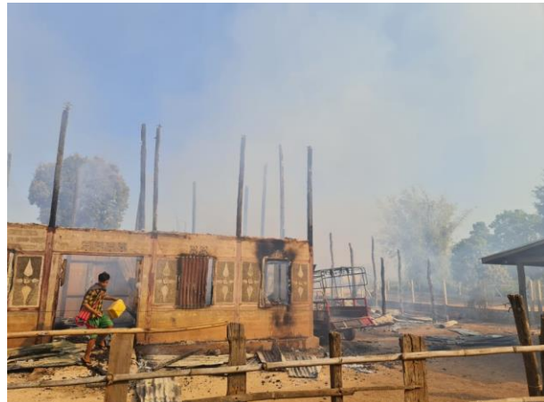
စကစ၏ လက်နက်ကြီးပစ်ခတ်မှုကြောင့် ဒီးလောင်သွားသည့်အိမ် လျှင်ကော်

ဖေဖော်ဝါရီလ (၄)ရက်နေ့၊ စစ်ကောင်စီကြီး လက်နက်ကြီးရမ်းသမ်းပစ်ခတ်မှုကြောင့် ဒီးမော့ဆိုမြို့၊ နောင်ပုလဲ ကျေးရွာအုပ်စုအတွင်း စစ်ဘေးရှောင်များ အများအပြားလာရောက်နေထိုင်နေသည့် နေရာသို့ လက်နက်ကြီး ကျရောက်ခဲ့သည့်အတွက် အမျိုးသား(၃)ဦးနှင့် အမျိုးသမီး(၁)ဦး ထိမှန်ဒဏ်ရာရရှိခဲ့ပြီး ဘာသာရေး အဆောက်အဦး (၂)လုံး၊ ကား (၂)စီး နှင့် အိမ်(၂)လုံး လက်နက်ကြီး ထိမှန်ခဲ့ပါသည်။