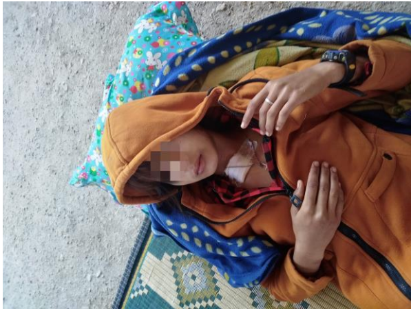
စကစ၏ လက်နက်ကြီးပစ်ခတ်မှုကြောင့် ထိခိုက်ဒဏ်ရာ ရရှိသော အမျိုးသမီးငယ်