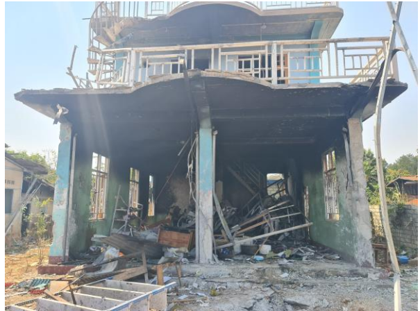
စကစ၏ လေယာဉ်ဖြင့် ဗုံးကြဲတိုက်ခိုက်ခြင်းကြောင့် ပျက်စီးသွားသောအိမ်

ဖေဖော်ဝါရီလ ၁၈ ရက်နေ့၊ ဒီးမော့ဆိုမြို့နယ်၊ ဝီးသဲကူး မြောက်ရွာတွင် တိုက်ပွဲဖြစ်ပွားခဲ့ပြီး စစ်ကောင်စီတပ်မှ အရာရှိအရာခံအပါအဝင် ၂၅ဦးထက်မနည်းသေဆုံးပြီး ထိခိုက်ဒဏ်ရာရရှိခဲ့သည်။ တိုက်ပွဲအတွင်း DMO-PDF ဖက်က တပ်ဖွဲ့ဝင် ၃ဦး ထိခိုက်ဒဏ်ရာရရှိခဲ့သလို မဟာမိတ်ပူးပေါင်းတပ်ကလည်း ထိခိုက်မှုရှိကြောင်း ထုတ်ပြန်ထားသည်။ စစ်ကောင်စီတပ်မှ သံချပ်ကာအမြောက်ကား ၂စီး ပစ်ကူခဲ့သည့်အပြင် ညနေ ၄နာရီကျော်အချိန်တွင် တိုက်လေယာဉ်နှစ်စီးဖြင့် လာရောက်ဗုံးကြဲတိုက်ခိုက်ခဲ့သည်။