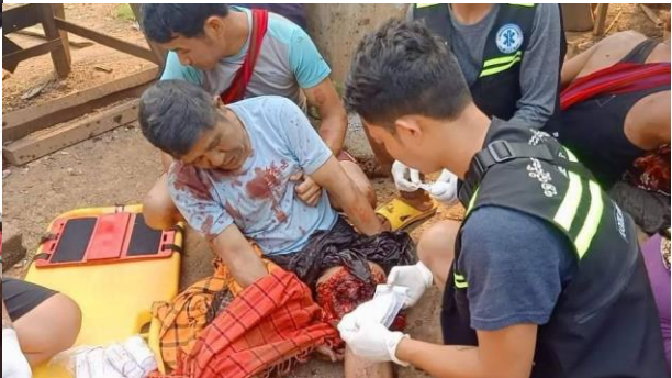
စကစပစ်ခတ်သည့် လက်နက်ကြီး အရပ်သားများအား ထိမှန် လွိုင်ကော်

ဧပြီလ (၅)ရက်နေ့၊ ကရင်နီပြည်၊ လွိုင်လင်လေးမြို့နေ လင်မယားနှစ်ဦးထံမှ WY ဆေးပြား၁၂၉၃ပြားနှင့် ငွေသား ၄ သိန်းခန့်ကို KNDF B012, KSP, K.R.G Forces တို့ ပူးပေါင်းဖမ်းဆီးရမိခဲ့ပါသည်။ ၎င်းဆေးပြားများအား ကရင်နီတပ်များမှ ဖျက်စီးလိုက်သည်။