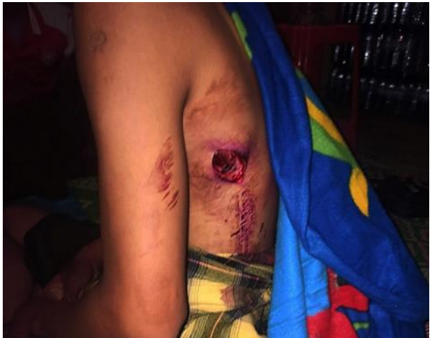
စကစ၏ လက်နက်ကြီးပစ်ခတ်ခြင်းကြောင့် လွယ်ပါးစုံရွာသားတစ်ဦး ထိမှန်ဒဏ်ရာရရှိ

မေလ ၂၁ ရက်နေ့၊ ဖယ်ခုံအရှေ့ဘက်ကမ်း ဆီးမီးလော့ရွာ၌ စစ်ကောင်စီတပ်များနှင့် KNDF တပ်ရင်း -၃၊ တပ်ရင်း -၁၁ နှင့် ကရင်နီတပ်မတော်(KA)တို့ နေ့လည် ၁နာရီခွဲအချိန်မှ ညနေ ၄ နာရီခွဲအချိန်ထိ တိုက်ပွဲ ဖြစ်ပွားကာ စစ်ကောင်စီတပ်များမှ (၄)ဦး သေဆုံးသည်။ ထိုနေ့တွင် စစ်ကောင်စီတပ်များသည် တိုက်ပွဲ ဖြစ်ပွားခြင်းမရှိဘဲ လက်နက်ကြီးများ ရမ်းသမ်းပစ်ခတ်မှုများကြောင့် ဖယ်ခုံအင်းအရှေ့ဘက်ကမ်းရှိ ကရင်ကျေးရွာအုပ်စု ညောင်မွန်းကျေးရွာအတွင်းသို့ လက်နက်ကြီး ကျရောက်ပေါက်ကွဲကာ စပါးကျီ ၁လုံးမီးလောင်ပျက်စီးကာ နေအိမ်အချို့လည်း ပျက်စီးမှုများ ရှိသည်။ ထိုတရက်တည်းတွင် ဒီးမော့ဆိုမြို့နယ်၊ ဒီးမော့ဆိုမြို့မတံတားရှိ စစ်ကောင်စီ၏ ကင်းပုန်းတစ်ခုအား နံနက် ၈ နာရီအချိန်တွင် ကရင်နီပြည်သူ့ ကာကွယ်ရေးတပ်ဖွဲ့များမှ သွားရောက်တိုက်ခိုက်ခဲ့သည်။ သည့်အပြင် အင်အားဖြည့်တင်းရန်လာသော