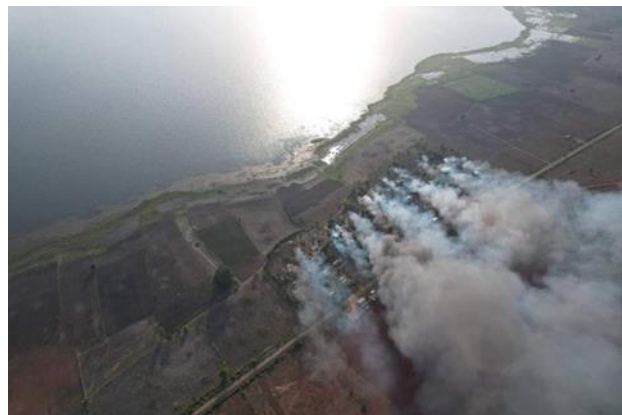
ဆောင်နန်းခဲကျေးရွာအား စစ်ကောင်စီ မီးရှို့

မေလ ၂၀ ရက်နေ့၊ ဖယ်ခုံမြို့နယ်တွင် နံနက် ၈နာရီမှ ညနေ ၆ နာရီအထိ ကရင်နီဒေသခံကာကွယ်ရေး တပ်ဖွဲ့များနှင့် စစ်ကောင်စီတို့ နန်းပေါ်လုံကျေးရွာတွင် တိုက်ပွဲဖြစ်ပွားခဲ့ပြီး ကရင်နီဒေသခံကာကွယ်ရေးတပ်ဖွဲ့မှ ဘဦးကျဆုံးသွားခဲ့သည်။ တိုက်ပွဲဖြစ်ပွားသည့် နန်းပေါ်လုံကျေးရွာအား စစ်ကောင်စီမှ နေအိမ် ၃လုံးအား မီးရှို့ ဖျက်စီးသွားခဲ့သည်။