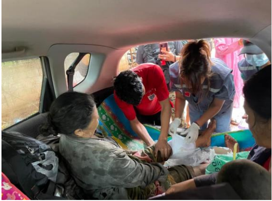
စကစ၏ လက်နက်ကြီးပစ်ခတ်ခြင်းကြောင့် ထိမှန်ဒဏ်ရာရရှိသွားသည့် ဒီးမော့ဆိုမှ အရပ်သားများ

ဇွန်လ ၁၅ရက်နေ့၊ ဖရူဆိုမြို့နယ်၊ ဒေါညေးခူရွာတွင် စစ်ကောင်စီတပ်နှင့် ကာကွယ်ရေးတပ်များ တိုက်ပွဲပြင်းထန်ခဲ့ပြီး တိုက်ပွဲတွင် စစ်ကောင်စီတပ်မှ (၄)ဦးကျဆုံးခဲ့ပါသည်။ ညနေ (၃)နာရီကျော်အချိန်တွင် စစ်ကောင်စီတပ်မှ ဒေါညေးခူကျေးရွာရှိ ကက်သလစ်ဘုရားရှိခိုးကျောင်း၊ ဘုန်းတော်ကြီးနေအိမ် နှင့် ဓမ္မရုံတို့အား မီးရှို့ဖျက်ဆီးခဲ့ပါသည်။