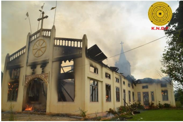
စကစမှ ဖရူဆို၊ ဒေါညေးခူကျေးရွာ ကက်သလစ်ဘုရားရှိခိုးကျောင်းအား မီးရှို့ဖျက်စီး