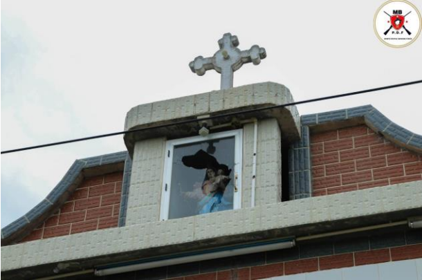
စကစမှ ပစ်ခတ်လိုက်သည့် လက်နက်ကြီး အရပ်သားများအား ထိမှန် စကစမှ ဖျက်စီးသွားသော မိုးပြဲမြို့မှ ဘုရားကျောင်း

ဇူလိုင်လ (၃၁) ရက်နေ့၊ နံနက်ပိုင်း ၁၁ နာရီအချိန်တွင် ဒီးမော့ဆိုမြို့နယ်၊ အူးခူးရီကျေးရွာအနီးတွင် လုံခြုံရေးယူနေသော KNDF B05 နှင့်စစ်ကောင်စီတပ်တို့ နေ့လည် ၁၁ နာရီအချိန်တွင် ထိတွေ့တိုက်ပွဲ ဖြစ်ပွားခဲ့ပါသည်။ ထိတွေ့တိုက်ပွဲများအတွင်း စစ်ကောင်စီတပ်ဘက်မှ ထိခိုက်သေဆုံးမှုများ ရှိခဲ့သော်လည်း အသေအပျောက် စာရင်းအတိအကျ မသိရပေ။ ထိုတရက်တည်းတွင် ငွေတောင်တွင်ရှိသော စစ်ကောင်စီ၏ (၁၀၂)တပ်ရင်းနှင့် ဖရူဆိုအခြေစိုက် (၁၂၈)တပ်ရင်းတို့မှ လက်နက်ကြီးဖြင့် ၁၀ ကြိမ်ခန့် ပစ်ခတ်ခဲ့သည်။ ပစ်ခတ်လိုက်သော လက်နက်ကြီးများသည် စစ်ရှောင်စခန်းဘက် ကျခဲ့တာကြောင့် အသက် ၁၃ နှစ်အရွယ် စစ်ရှောင်အမျိုးသမီးငယ်တစ်ဦး သေဆုံးသွားခဲ့သည့်အပြင် နောက်ထပ် ၄ဦး ဒဏ်ရာရခဲ့သည်။ အလားတူ ဒီးမော့ဆိုအရှေ့ဖက်ခြမ်း ကျေးရွာတစ်ရွာထဲသို့ လက်နက်ကြီး ဖလုံးကျရောက်ခဲ့ပြီး နေအိမ်တစ်လုံး ပျက်စီးခဲ့သည့်အပြင် အသက် ၂နှစ်လအရွယ်ကလေးတစ်ဦးအား လက်နက်ကြီးစ ရှပ်ထိမှန်သွားခဲ့သည်။