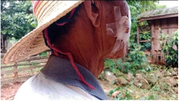
စကစမှ ထောင်ထားခဲ့သော ဗုံးများ ဒီးမော့ဆို စကစမှ ပစ်ခတ်လိုက်သော လက်နက်ကြီးအား သက်ကြီးအမျိုးသားတစ်ဦး ထိမှန် ဒီးမော့ဆို

ဩဂုတ်လ ၂၀ရက်နေ့၊ ဒီးမော့ဆိုမြို့နယ်၊ ရူးဖယ်ခူရပ်ကွက်ရှိ ခြေတော်ရာဘုရားနှင့် သဲတောင် အနီးတွင် စစ်ကောင်စီတပ်နှင့် KA, KNDF B-19 တို့ နံနက် ၆ နာရီမှ ညနေအထိ တစ်နေ့ကျန်နီးပါး တိုက်ပွဲဖြစ်ပွားခဲ့ပြီး တိုက်ပွဲတွင် စစ်ကောင်စီတပ်မှ လက်နက်ကြီးများနှင့် အတွဲလိုက် ခုံးများပါ အသုံးပြုခဲ့သည့်အတွက် ကရင်နီ အမျိုးသားများကာကွယ်ရေးတပ်ဖွဲ့မှ ရဲဘော်တစ်ဦး ကျဆုံးသွားခဲ့သည်။