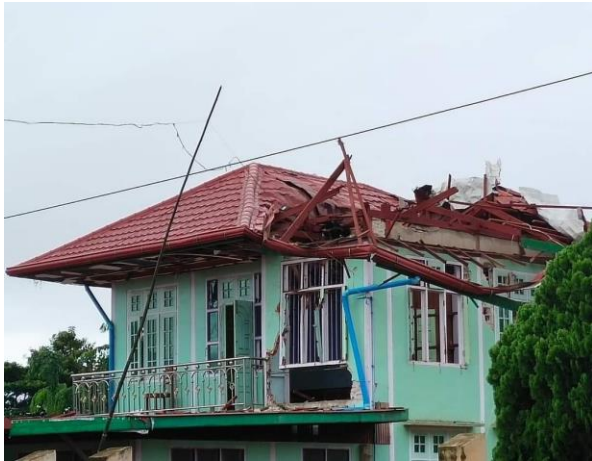
လက်နက်ကြီးကြောင့် ပျက်စီးသွားသည့် မိုးမြို့မြို့နေအိမ်