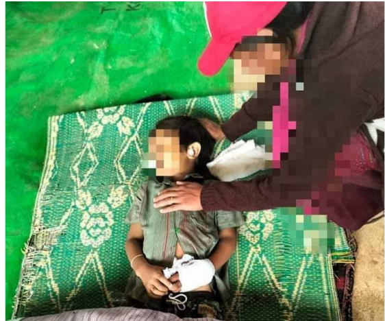
စကစ၏လက်နက်ကြီးကြောင့်မိုးမြို့မြို့ကလေးတစ်ဦးထိမှန်သေဆုံးသွားခြင်း

စက်တင်ဘာလ ၁၁ ရက်နေ့၊ နံနက် ၇နာရီအချိန်မှစ၍ ပွဲကုန်း (၃)ရပ်ကွက် ဘုရားကျောင်းဝန်းကျင်တွင် တပ်စွဲရန်ကြိုးစားသော စစ်ကောင်စီတပ်များအား KNDF B/03၊ B/11၊ KA၊ မိုးမြို့ PDF၊ ဖယ်ခုံ PDF၊ KRU၊ URF တို့ပူးပေါင်း၍ တစ်နေ့ကုန်နီးပါး တိုက်ပွဲပြင်းထန်ခဲ့သည်။ တိုက်ပွဲအတွင်း စစ်ကောင်စီတပ်များမှ ၂၀ ဦးသေဆုံးကာ အများအပြားဒဏ်ရာရရှိပြီး ကရင်နီပူးပေါင်းတပ်များမှ (၂)ဦး ကျဆုံးသည်။ ထိုတိုက်ပွဲတွင် စစ်ကောင်စီတပ်များမှ လက်နက်ကြီးများဖြင့် အလွန်အကျွံအသုံးပြုသည့်အပြင် ညနေပိုင်းတွင်းလည်း တိုက်လေယာဉ်ဖြင့် ၂ ကြိမ်ပုံးကြဲတိုက်ခိုက်သွားခဲ့သည်။ မိုးမြို့မြို့၏ လေးရက်မြောက်တိုက်ပွဲအတွင်း စစ်ကောင်စီတပ်များမှ လက်နက်ကြီးများဖြင့် ရမ်းသန်းပစ်ခတ်သည့်အတွက် ပွဲကုန်း ၁-၂-၃ ရပ်ကွက်မှ နေအိမ် ၁၀၀ လုံး ထက်မနည်း ထိမှန်ပျက်စီးခဲ့သည်။ ထိုတရက်တည်းတွင်လည်း ဖရူဆိုမြို့နယ်၊ ဒေါ်ညေးခူကျေးရွာသို့ ဝင်ရောက် လာသည့် အာဏာသိမ်းစစ်ကောင်စီတပ်များနှင့် နေ့လည်ပိုင်းတွင် KA၊ KNDF B/15၊ B/04 တို့မှ အနီးကပ် တိုက်ခိုက်ခဲ့ပြီး စစ်ကောင်စီတပ်သား ၂ ဦးသေဆုံး၍ KA မှ ရဲဘော်တစ်ဦး ဒဏ်ရာရရှိသွားခဲ့သည်။