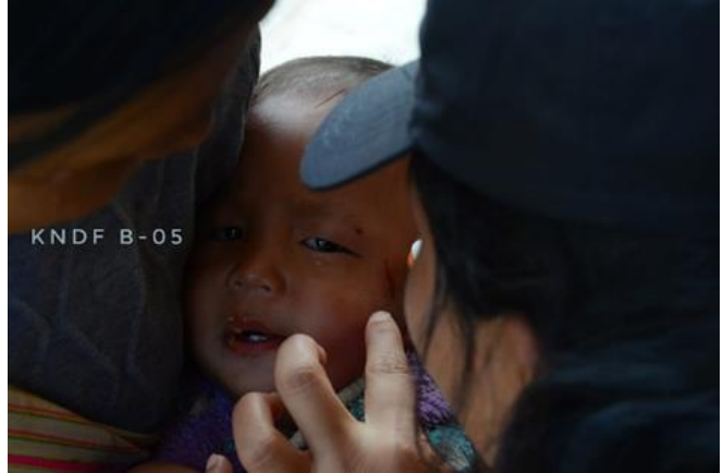
၁၀ လသားကလေး စကစ ထောင်ထားသော မြေမြုပ်ခိုင်းထိမှန် ဒါဏ်ရာရရှိ ဒီးမော့ဆို

စက်တင်ဘာလ ၂၁ ရက်နေ့၊ လွိုင်ကော်မြို့နယ်အတွင်းရှိ ဆောင်ကန်းကျေးရွာအတွင်းသို့ လွိုင်ကော် အမြောက်တပ်မှ တိုက်ပွဲဖြစ်ပွားခြင်းမရှိပဲ လက်နက်ကြီးများဖြင့် ပစ်ခတ်ခဲ့သည့်အတွက် လက်နက်ကြီး ၂လုံး ကျရောက် ပေါက်ကွဲကာ အသက် (၆၀)အရွယ်ရှိ အမျိုးသားတစ်ဦး ထိမှန်သေဆုံးသွားခဲ့သည်။ သည့်အပြင် ဒီးမော့ဆိုအနောက်ခြမ်းတွင် ဆိုင်ကယ်ဖြင့် ရိက္ခာပြန်လာယူသည့် မိသားစုတစ်စု စစ်ကောင်စီ ထောင်ထားခဲ့သော မြေမြုပ်ခိုင်းနင်းမိပြီး အသက်(၄၀)အရွယ်ရှိ အမျိုးသားတစ်ဦး ခြေထောက်တွင် ထိမှန်ဒဏ်ရာရရှိပြီး ၎င်းနှင့်ပါလာသော ၁၀လသားအရွယ် ကလေးငယ်တစ်ဦးလည်း အနည်းငယ်ထိမှန် ဒဏ်ရာရရှိသွားခဲ့သည်။