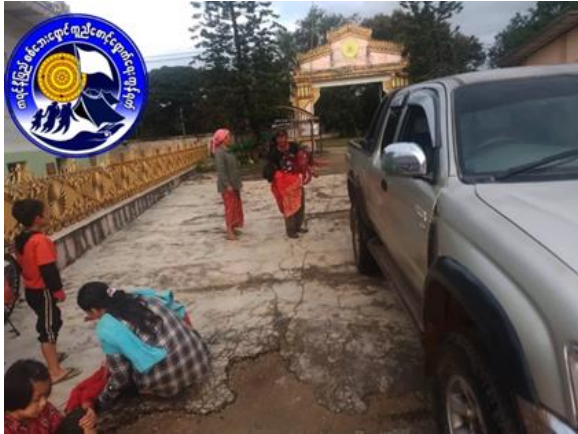
စကစလက်နက်ကြီး ပစ်ခတ်ခြင်းကြောင့် မိုးမြို့မြို့မှ အရပ်သားများသေဆုံးခြင်း