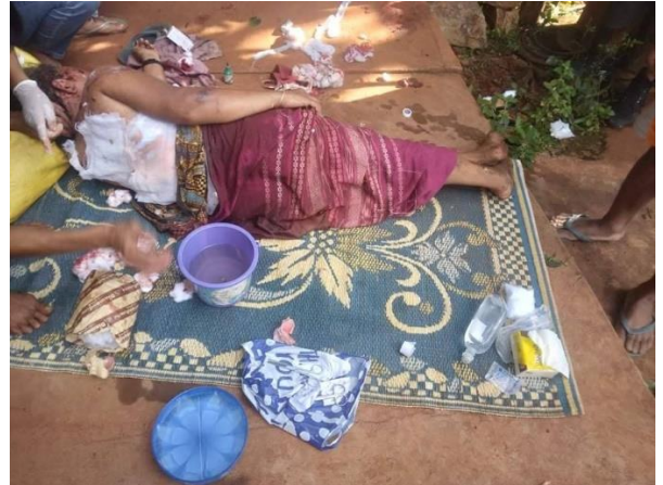
လက်နက်ကြီးကြောင့် ပျက်စီးသွားသော ဒီးမော့ဆိုမှ နှစ်ခြင်းဘုရားကျောင်း၊ လက်နက်ကြီးကြောင့် ထိခိုက်သေဆုံးမှု ရှိခဲ့သော ကုန်းသာကျေးရွာမှ အရပ်သားများ လှိုင်ကော်

အောက်တိုဘာလ ၂ ရက်နေ့၊ တိုက်ပွဲဖြစ်ပွားခြင်းမရှိဘဲ စစ်ကောင်စီတပ်များသည် လှိုင်ကော်အရှေ့ခြမ်းသို့ လက်နက်ကြီး အကြိမ်ရေ ၃၀ ထက်မနည်း ပစ်ခတ်ခဲ့သည်။ လက်နက်ကြီး ပစ်ခတ်မှုများသည် အရပ်သား နေထိုင်သော နေရာသို့ နှစ်လုံးကျရောက်ပေါက်ကွဲခဲ့သော်လည်း နေအိမ်ထိခိုက်ပျက်စီးမှုများ အရပ်သား ထိခိုက်သေဆုံးမှုများ မရှိပေ။