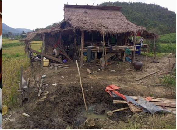
မိုးဖြူတွင် ပစ်ခတ်ခံရသည့် အရပ်သားတစ်ဦး