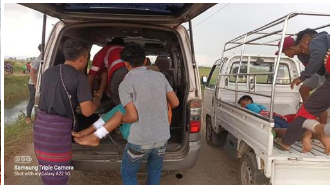
စကစလက်နက်ကြီးပစ်ခတ်မှုကြောင့် ပီကင်းကော့ကျေးရွာမှ ကလေးများ ထိခိုက်ဒဏ်ရာရ လွိုင်ကော်မြို့နယ်

အောက်တိုဘာလ ၂၉ရက်၊ မိုးမြဲ-လွိုင်ကော်လမ်းမကြီးပေါ်တွင် ဆိုင်ကယ်မောင်းနှင်လာသည့် အသက် (၃၅)နှစ်အရွယ် အမျိုးသားတစ်ဦး စစ်ကောင်စီ၏ ပစ်ခတ်မှုကြောင့် ကျည်ထိမှန်ဒဏ်ရာရရှိခဲ့ပါသည်။ ထိုနေ့ နေ့လည် ၁ နာရီခန့်တွင် စစ်ကောင်စီတပ်နှင့် တော်လှန်ရေးတပ်ဖွဲ့များအကြား လွိုင်ကော်မြို့နယ်၊ ကုန်းသာကျေးရွာနှင့် ဆောင်ကန်းကျေးရွာကြားတွင် တိုက်ပွဲဖြစ်ပွားနေချိန် ဖြတ်သွားနေသည့် အရပ်သားတစ်ဦး သေနတ်ကျည်ထိမှန် ဒဏ်ရာရရှိသွားခဲ့သည်။