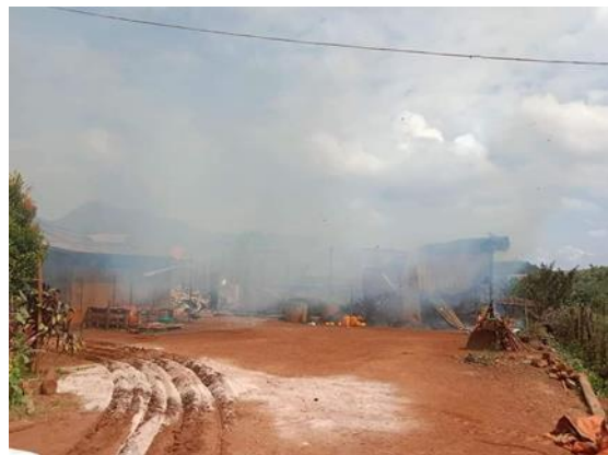
စကစ လက်နက်ကြီးပစ်ခတ်မှုကြောင့် ကုန်းစုံရွာမှ နေအိမ်တစ်လုံးစီးလောက်ပျက်စီး

အောက်တိုဘာလ ၂၇ရက်၊ ရှားတောမြို့နယ်၊ ပွန်ချောင်းကျေးရွာအနီးရှိ စစ်ကောင်စီတပ်စခန်းကို KA, KNDF B-14 တို့မှ ပူးပေါင်းတိုက်ခိုက်ခဲ့ပါသည်။ တိုက်ပွဲအပြီး စစ်ကောင်စီတပ်မှ လက်နက်ကြီး ရမ်းသန်းပစ်ခတ်ခြင်းကြောင့် ပွန်ချောင်းကျေးရွာရှိ နေအိမ်တစ်လုံး ထိခိုက်ပျက်စီးခဲ့ပါသည်။