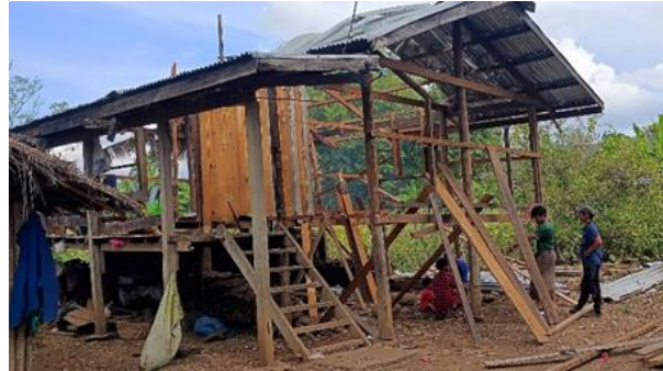
စကစ လက်နက်ကြီးကြောင့် ဖယ်ခုံအင်းအရှေ့ခြမ်းရှိ နေအိမ်ပျက်စီး

နိုဝင်ဘာလ ၁၄ရက်၊ ဖယ်ခုံမြို့နယ်၊ မိုးဗြဲအရှေ့ဘက်ရှိ ကျေးရွာတစ်ရွာတွင် မိုးဗြဲအခြေစိုက် ခမရ ၄၂၂တပ်မှ ပစ်ခတ်သည့် လက်နက်ကြီး ကျရောက်ပေါက်ကွဲမှုကြောင့် အသက် (၃၀)နှစ်အရွယ် အမျိုးသားတစ်ဦးနှင့် (၇)နှစ်အရွယ် ကလေးငယ်တစ်ဦးထိမှန်ခဲ့ပြီး အနည်းဆုံး နေအိမ်လေးလုံးထိမှန် ပျက်စီးသွားခဲ့ပါသည်။ ထိုတရက်တွင် လောပိတကျေးရွာအုပ်စုအတွင်းရှိ မွေးရာပါ စကားမပြောတတ်သည့် အသက် ၃၂ နှစ်အရွယ်ရှိ ယောက်ျားလေးတစ်ဦးကို စစ်ကောင်စီတပ်မှ ဖမ်းဆီးပြီး ညှင်းပန်းနှိပ်စက်မှုများ ပြုလုပ်ပြီးနောက် ပြန်လွှတ်ပေးခဲ့ပါသည်။