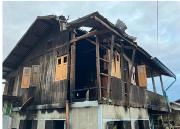
စကစ၏ လက်နက်ကြီးကြောင့် ဒီးမော့ဆိုတွင် နေအိမ်တစ်လုံးမီးလောင်

နိုဝင်ဘာလ ၂၅ ရက်နေ့၊ ဖရူဆိုမြို့နယ်အတွင်းတွင် ရှိသော စစ်ကောင်စီ၏ အမှတ် (၁၄)တန်းမြင့် စစ်လေ့ကျင့်ရေးကျောင်းအား ကရင်နီတပ်မတော် ( KA )၊ ကရင်နီအမျိုးသားများ ကာကွယ်ရေးတပ် ( KNDF ) တပ်ရင်း ( ၁၅ ) တို့ သွားရောက်တိုက်ခိုက်ခဲ့ပြီး စစ်ကောင်စီစစ်သား (၃)ဦး သေဆုံးသွားပါသည်။ ည ၇ နာရီခွဲ အချိန်တွင် ဒီးမော့ဆိုအခြေစိုက် ၁၀၂ တပ်မှ ဒီးမော့ဆိုမြို့နယ်အတွင်းရှိ ကျေးရွာများသို့ လက်နက်ကြီး ၁၀ လုံး ထက်မနည်း ပစ်ခတ်ခဲ့သည့်အတွက် လူနေအိမ် တစ်လုံးထိမှန် မီးလောင်သွားခဲ့ပါသည်။ ည ၁၁ နာရီအချိန်တွင် လွိုင်ကော်မြို့နယ်အတွင်း စကစမှ လက်နက်ကြီး ပစ်ခတ်မှုကြောင့် အမျိုးသားတစ်ဦး ထိမှန်ဒဏ်ရာ ရရှိသွားခဲ့သည်။