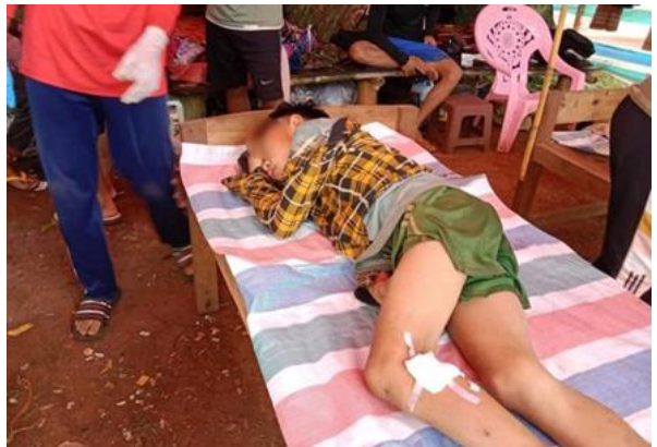
မိုးဗြဲတွင် ကလေးများ စစ်ကောင်စီ ထောင်ထားသော မိုင်းနင်းမိ

နိုဝင်ဘာလ ၂၆ ရက်နေ့၊ နိုဝင်ဘာလ ၂၆ ရက်နေ့တွင် ဖရူဆိုမြို့နယ်ရှိ စစ်ကောင်စီ၏ အမှတ် (၁၄) တန်းမြင့် စစ်လေ့ကျင့်ရေးကျောင်းနှင့် မားခရော်ရှေ့ ခြေကုပ်စခန်းတို့ကို KNDF B-15 မှသွားရောက်တိုက်ခိုက်ခဲ့ပြီး စစ်ကောင်စီတစ်ဦး သေဆုံးခဲ့ပါသည်။