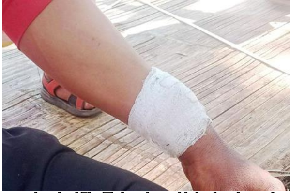
စကစ၏ လက်နက်ကြီးကြောင့် အရပ်သား ထိခိုက်ဒဏ်ရာရရှိမှု၊ ဖရူဆို