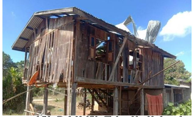
စကစဒရုန်းဖြင့်ပုံးကြတိုက်ခိုက်ခြင်းကြောင့် နေအိမ်ပျက်စီး၊ ဒီးမော့ဆို

ဒီဇင်ဘာလ ၁၃ရက်၊ ဖရူဆိုမြို့နယ်၊ လောဘူးဒါးရပ်ကွက်တွင် ခြေကုပ်ယူရန် အင်အား (၅၀)ခန့်ဖြင့် စစ်ကြောင်းထိုးလာသည့် စစ်ကောင်စီတပ်ကို KA, KNDF B-4 တို့မှ ဝင်ရောက်တိုက်ခိုက်ပြီး စစ်ကောင်စီတပ်မှ တစ်ဦးသေ၊ တစ်ဦးဒဏ်ရာရရှိခဲ့ပါသည်။ ထို့အပြင် စစ်ကောင်စီတပ်သည် ဒီးမော့ဆိုမြို့နယ်၊ စံပြ (၆)မိုင်နှင့် ဘက်သလိန်ကျေးရွာဘက်သို့ စစ်ကြောင်းထိုးရာ KNDF B-09 နှင့် (၃)ကြိမ် ထိတွေ့မှုရှိခဲ့ပြီး စစ်ကောင်စီတပ်မှ (၃၀)ဦးခန့် ထိခိုက်ဒဏ်ရာရရှိခဲ့ပါသည်။ ထို့အပြင် ဘက်သလိန်ကျေးရွာနှင့် ဝမ်လထွားကျေးရွာအား စစ်ကောင်စီတပ်များမှ မီးရှို့သွားခဲ့သည်။ ထိုတရက်တည်းတွင် စစ်ကောင်စီတပ်မှ လက်နက်ကြီးများ ရမ်းသန်းပစ်ခတ်ခြင်းကြောင့် ဒီးမော့ဆိုမြို့နယ်၊ ဒေါစဲကျေးရွာအတွင်း လက်နက်ကြီးကျရောက်ခဲ့ပြီး အမျိုးသား တစ်ဦးထိခိုက်သေဆုံးခဲ့သည်။ ထို့အတူ ဒီဇင်ဘာ ၁၃ ရက်နေ့၊ နေ့လည် (၁၁)နာရီအချိန်ခန့်တွင် ဒီးမော့ဆို အရှေ့ခြမ်းရှိ ရွာတစ်ရွာသို့ စစ်ကောင်စီမှ လက်နက်ကြီးဖြင့်ပစ်ခတ်၍ အသက် (၃၀)အရွယ် စစ်ရှောင်အမျိုးသမီး တစ်ဦး ရင်ဘတ်တွင် လက်နက်ကြီးစ ထိမှန်ခြင်းကြောင့် ပွဲချင်းပြီးသေဆုံးခဲ့ပါသည်။ ထိုရက်ည ၈ နာရီ ၅၀ မိနစ်အချိန်တွင် ရှမ်း-ကရင်နီနယ်စပ် ဆော်ဒီးဒေါကျေးရွာအနီး နေပြည်တော်သို့ သွယ်တန်းသွားသည့် ဓါတ်အားလိုင်း တာဝါတိုင်အမှတ် ၁၁၁နှင့်၁၁၂ အား ဒေသခံ PDF မှ မိုင်းခွဲဖျက်စီးခဲ့သည်။