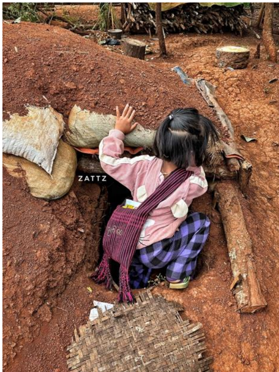
အိုင်ဒီပီ ကျောင်းသား၊ သူများ လေယာဉ်သံကြား၍ ပုန်းအောင်းနေကြစဉ်