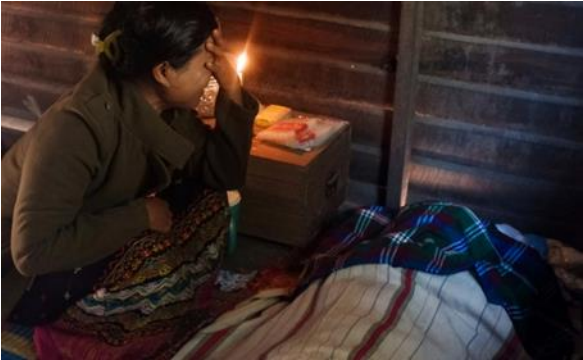
ထီးဆို စစ်ဘေးရှောင်စခန်းမှ လက်နက်ကြီးထိမှန်သေဆုံး ဒီးမော့ဆိုမြို့နယ်

ဇန်နဝါရီလ (၈)ရက်၊ ည (၈)နာရီအချိန်ခန့်တွင် စစ်ကောင်စီတပ် ခမရ ၄၂၂ တပ်မှ လက်နက်ကြီး ပစ်ခတ်ခြင်းကြောင့် မိုးမြဲမြို့၊ ပွဲကုန်း ၁ ရပ်ကွက်အတွင်း ကျရောက်ပေါက်ကွဲခဲ့ပြီး အသက် ၆၆နှစ်အရွယ် အမျိုးသားတစ်ဦး ထိမှန် သေဆုံးသွားခဲ့ပါသည်။