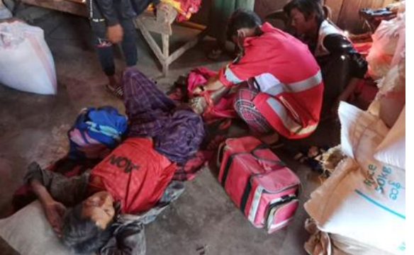
စကခ၏ လက်နက်ကြီးကြောင့် အရပ်သားများ ထိမှန်ဒဏ်ရာရရှိ လွိုင်ကော်မြို့နယ်