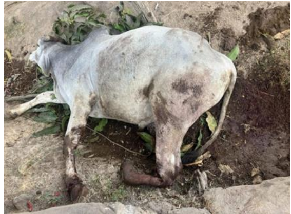
စကစ၏ လက်နက်ကြီးပစ်ခတ်ကြောင့် IDP အဆောက်အအုံပျက်စီး၊ ဒီးမော့ဆို စကစ၏ လက်နက်ကြီးပစ်ခတ်ခြင်းကြောင့် ရွာသားများ၏နွား ထိမှန်သေဆုံး၊ ဒီးမော့ဆို

ဇန်နဝါရီလ (၂၃)ရက်၊ ည ၁၂:၀၀ နာရီအချိန်တွင် စစ်ကောင်စီမှ တိုက်ခိုက်ရေးလေယာဉ်ဖြင့် လွိုင်ကော်မြို့နယ် အရှေ့ခြမ်းသို့ စစ်ဘေးရှောင်များနေထိုင်သော နေရာအား ၂ ကြိမ်ဖြင့် ဗုံးကြဲတိုက်ခိုက်ခဲ့သည်။