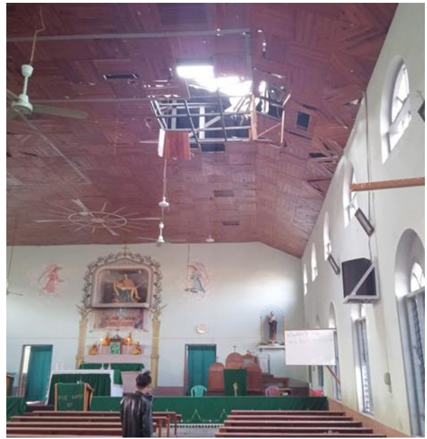
ဝါရီကော့ခူကျေးရွာ၊ လွိုင်ကော်မြို့နယ်ရှိ ကက်သလစ်ဘုရားရှိခိုးကျောင်းအား လက်နက်ကြီးဖြင့် ပစ်ခတ်

ဖေဖော်ဝါရီလ ၆ ရက်၊ ဒီးမော့ဆိုမြို့နယ်၊ ဇရပ်ဖြူလမ်းတွင် အမျိုးသား ၆ ဦး စီးနင်လာသော ကားတစ်စီးသည် မိုးနင်းမိပြီး ၄ ဦးသေဆုံးကာ ၂ ဦးသည် ပြင်းထန်စွာ ဒဏ်ရာရရှိခဲ့သည်။