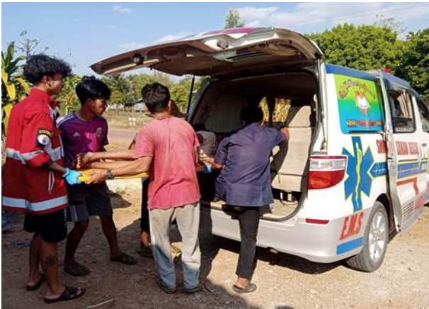
အမျိုးသားတစ်ဦး လက်နက်ကြီးထိမှန်၊ လွိုင်ကော်မြို့နယ်

ဖေဖော်ဝါရီလ ၁၆ရက်၊ ဖရူဆိုမြို့နယ်အခြေစိုက် ခမရ (၅၃၁) တပ်ရင်းမှ ၎င်းတို့၏တပ်အတွင်း သန့်ရှင်းရေး ပြုလုပ်နေစဉ် ချောင်းမြောင်းတိုက်ခိုက်ခံရမှုကြောင့် စစ်ကောင်စီတပ်သားတစ်ဦး ထိမှန်သေဆုံး ခဲ့ပါသည်။