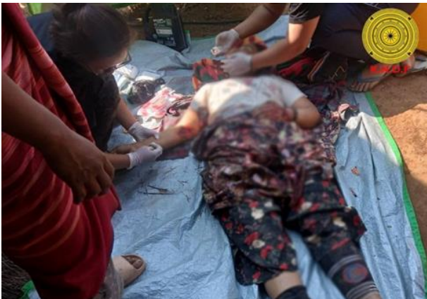
အမျိုးသမီးတစ်ဦး လက်နက်ကြီးထိမှန်သေဆုံး၊ ပင်လောင်းမြို့နယ်