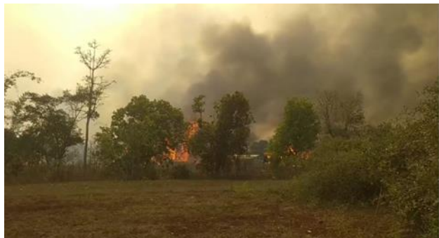
ရေနီပေါက်ကျေးရွာမှ ဘုန်းကြီးကျောင်း လက်နက်ကြီးမှန်ပျက်စီး၊ ဘောလခဲ ဒေါတမကြီးကျေးရွာအုပ်စုအား လေကြောင်းဖြင့်ဗုံးကြဲတိုက်ခိုက်၍ နေအိမ်များမီးလောင်ပျက်စီး

မတ်လ ၂၄ ရက်၊ နေ့လည် ၁၀ နာရီကျော်အချိန်ခန့်တွင် ဒီးမော့ဆိုမြို့အနောက်ဘက်ခြမ်းကို စစ်ကောင်စီတပ်မှ လက်နက်ကြီးများပစ်ခတ်ခြင်းကြောင့် အရပ်သား (၂)ဦးထိမှန်ကာ နေအိမ်တစ်လုံး ထိမှန်ပျက်စီးခဲ့ပါသည်။ နေ့လည် ၁ နာရီ ၁၅ မိနစ်အချိန်တွင် စစ်ကောင်စီတပ်များသည် တိုက်လေယာဉ်တစ်စီး၊ ရဟတ်ယာဉ်နှစ်စီးဖြင့် ဒီးမော့ဆိုမြို့နယ် ဒေါတမကြီးကျေးရွာအတွင်းသို့ (၃)ကြိမ် ဗုံးကြဲတိုက်ခိုက်ခဲ့သည်။