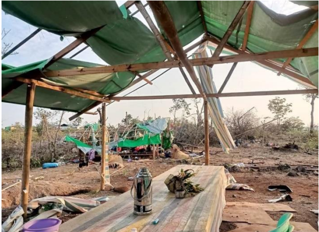
ဒီးမော့ဆိုအနောက်ခြမ်း အိုင်ဒီပီစခန်းများ လေယာဉ်ဖြင့် ဗုံးကြဲတိုက်ခိုက်ခံရ

မေလ ၂ရက်နေ့၊ ဒီးမော့ဆိုမြို့အရှေ့ဖက်ခြမ်းရှိ ဒေါညေးခူရွာခံ (၃)ဦးတို့မှ မနက် ၈ နာရီခွဲခန့်တွင် ရွာအတွင်း ပစ္စည်းပြန်ယူချိန်တွင် စစ်ကောင်စီတပ်မှ သေနတ်ဖြင့် ပစ်ခတ်ခဲ့ရာ ရွာသား (၃)တို့မှ ထွက်ပြေး လွတ်မြောက် သွားခဲ့ပါသည်။