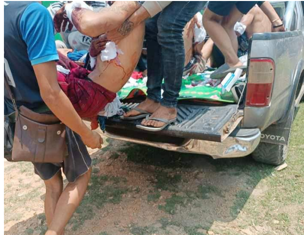
အရပ်သားများ လက်နက်ကြီးထိမှန်၊ ဖယ်ခုံမြို့နယ်

မေလ ၁ရက်နေ့၊ ဘောလခဲမြို့အတွင်း တပ်စွဲထားသည့် စစ်ကောင်စီတပ်ကို ဖားဆောင်းပြည်သူ့ကာကွယ်ရေးတပ်နှင့် ဘောလခဲပြည်သူ့ကာကွယ်ရေးတပ်မှ ဝင်ရောက်တိုက်ခိုက်ခဲ့ရာ စစ်ကောင်စီတပ်မှ (၇)ဦးသေဆုံးပြီး (၁၃)ဦးထက်မနည်း ထိခိုက်ဒဏ်ရာရရှိခဲ့ပါသည်။ တိုက်ပွဲအတွင်း ဘောလခဲပြည်သူ့ကာကွယ်ရေးတပ်မှ ရဲဘော် နှစ်ဦးလည်း ကျဆုံးခဲ့ပါသည်။