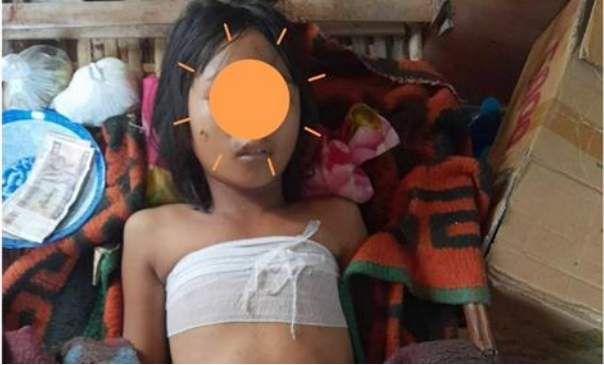
ဖယ်ခုံမြို့နယ်မှ ကယန်းပြည်သစ် လုံခြုံရေးဂိတ်အား စကစမှ ဗုံးကြဲတိုက်ခိုက် စကစ၏ လက်နက်ကြီးပစ်ခတ်မှုကြောင့် အမျိုးသမီးငယ်တစ်ဦး ထိခိုက်ဒဏ်ရာရှိ၊ လှိုင်ကော်မြို့နယ်

ဇွန်လ ၁ရက်၊ နံနက် ၄ နာရီအချိန်တွင် မိုးပြဲမြို့ အနောက်ဘက်ခြမ်းတွင် ထားရှိသော ကယန်းပြည်သစ် တပ်မတော်၏ လုံခြုံရေးဂိတ်တစ်နေရာအား စစ်ကောင်စီတပ်မှ လေယာဉ်ဖြင့် (၂)ကြိမ်ခန့် ဗုံးကြဲတိုက်ခိုက်ကာ ပျက်စီးသွားခဲ့သည့်အပြင် ဖယ်ခုံ-ပင်လောင်းနယ်စပ်မှ ခေါင်းအိ၊ ဖယ်ခုံ၊ စက်တော်ရာ၊ လွယ်လုံ၊ မြေနီကုန်း (၅) နေရာကို စစ်ကောင်စီတပ်မှ လေယာဉ် (၅)စီးဖြင့် ဗုံးကြဲတိုက်ခိုက်ခဲ့ပါသည်။