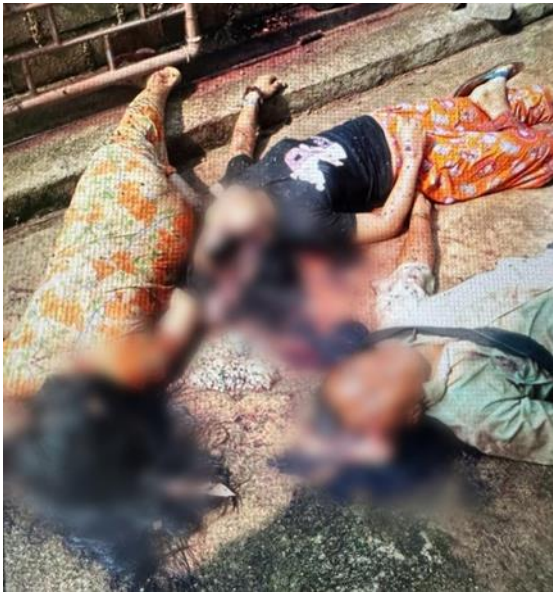
စကစတပ်များမှ အရပ်သားများ သတ်ဖြတ်ခြင်း၊ မိုးမြုံ

ထိမှန်ဒဏ်ရာရရှိသွားခဲ့သည့်အပြင် အိမ်ဆောက်ပစ္စည်းရောင်းသည့်ဆိုင်နှင့် ငွေသား သိန်း ၁၃၀ အပါအဝင် အခြားပစ္စည်းများ မီးလောင်ပျက်စီးသွားခဲ့သည်။