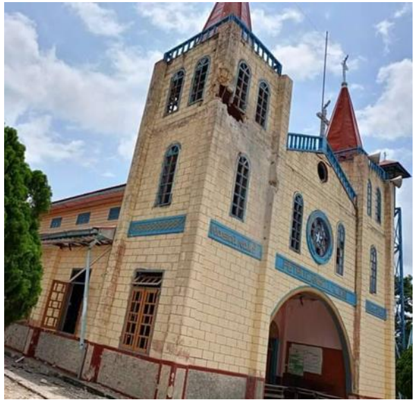
စကစ၏ လက်နက်ကြီးကြောင့် ပျက်စီးသွားသော ဘာသာရေးအဆောက်အဦး၊ မိုးမြုံ

ဇွန်လ ၁၀ ရက်၊ ဖယ်ခုံမြို့နယ်၊ ခေါင်းအိကျေးရွာတွင် ကရင်နီပူးပေါင်းတပ်များနှင့် စစ်ကောင်စီတပ်များ တိုက်ပွဲ ပြင်းထန်ခဲ့ပြီး တိုက်ပွဲအတွင်း ကရင်နီပူးပေါင်းတပ်များမှ ရဲဘော် ၂ ဦးကျဆုံးသွားခဲ့သည်။ ညနေ ၇ နာရီ အချိန်တွင် တိုက်ပွဲဖြစ်ပွားခြင်းမရှိဘဲ စစ်ကောင်စီတပ်မှ လက်နက်ကြီးများဖြင့် ဒီးမော့ဆို အနောက်ဘက်ခြမ်းသို့ ပစ်ခတ်ခဲ့သည့်အတွက် စစ်ဘေးရှောင်တစ်နေရာအတွင်းသို့ လက်နက်ကြီး ကျရောက်ပေါက်ကွဲကာ နေအိမ် တစ်လုံး ထိမှန်ပျက်စီးသွားခဲ့သည်။