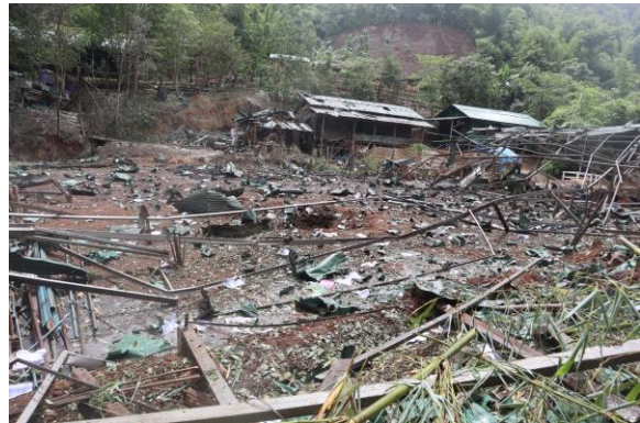
လေကြောင်းတိုက်ခိုက်ခံရပြီး ပျက်စီးသွားသော ဒေါနီးကူးမှ အဆောက်အအုံများ

ဇူလိုင် ၁၂ ရက်၊ မိုးမြဲမြို့မှ လွိုင်ကော်သို့ မောင်းနှင်လာသည့် စစ်ကောင်စီယာဉ်တန်းသည် လမ်းမကြီး တစ်လျှောက်တွင် လက်နက်ကြီး၊ လက်နက်ငယ်များဖြင့် ရမ်းသန်းပစ်ခတ်ခြင်းကြောင့် အသက် ၁၇ နှစ်အရွယ် တစ်ဦးအပါအဝင် အမျိုးသား(၂)ဦးနှင့် အမျိုးသမီးတစ်ဦးတို့ ထိမှန်သေဆုံးခဲ့ပါသည်။