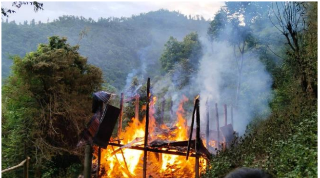
ဗုံးကြဲတိုက်ခိုက်ပြီး မီးလောင်ပျက်စီးသွားသော ဖရူဆိုအနောက်ခြမ်းရှိ နေအိမ်

ဇူလိုင်လ ၁၅ ရက်၊ မွန်းလွဲ ၂ နာရီခန့်တွင် ဖားဆောင်းမြို့နယ်၌ အသက် (၁၂) နှစ်အရွယ် ကလေးတစ်ဦး နွားကျောင်းနေစဉ် မိုင်းနှင်းမိပြီး ညာဖက်ခြေထောက် ဆုံးရှုံးခဲ့ရပါသည်။