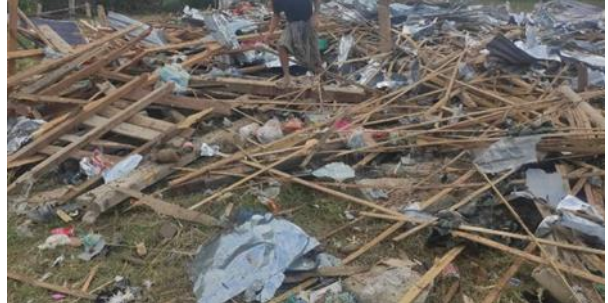
စကစ၏ ဗုံးကြဲတိုက်ခိုက်မှုကြောင့် ပျက်စီးသွားသော ထီးသော်ကူး ဘုရားကျောင်း၊ ဖရူဆိုမြို့နယ် လေကြောင်းနှင့် လက်နက်ကြီး ပစ်ခတ်မှုများကြောင့် ပျက်စီးသွားသော အဆောက်အဦးများ ဒီးမော့ဆို

ဩဂုတ်လ ၁၀ ရက်၊ နေ့လည် ၂ နာရီအချိန်တွင် စစ်ကောင်စီမှ ကရင်နီပုဂ္ဂိုလ်များနှင့် တိုက်ပွဲဖြစ်ပွား နေသော သဲတောင်အနီး လေယာဉ်ဖြင့် နှစ်ကြိမ် ဗုံးကြဲတိုက်ခိုက်ခဲ့ပြီး ညနေ ၄နာရီ ၁၅ မိနစ်အချိန်တွင်လည်း ထပ်မံပြီး ဗုံးကြဲတိုက်ခိုက်ခဲ့သည့်အတွက် အဆောက်အဦးများ ထိခိုက်ပျက်စီးမှုများ ရှိသည်။