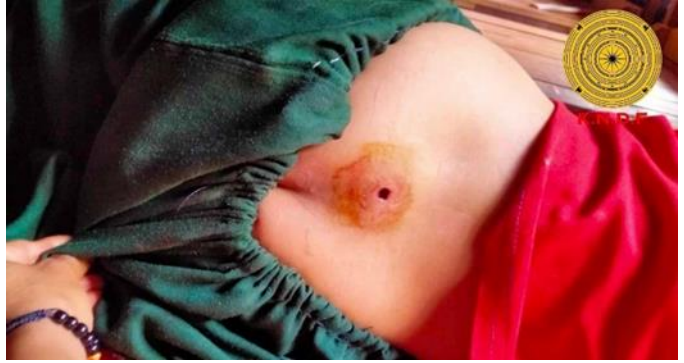
စကစ လေကြောင်းတိုက်ခိုက်မှုကြောင့် စာသင်ကျောင်းပျက်စီး စကစ ဒရုန်းတိုက်ခိုက်မှုကြောင့် ကလေးငယ် ထိခိုက်ဒဏ်ရာရရှိ

ဩဂုတ်လ ၂၃ ရက်၊ သံလွင်မြစ်အရှေ့ဘက်ခြမ်းရှိ ဆိုတရားမြို့နယ်၊ မယ်လယုတွင် စစ်ကောင်စီတပ် ၁၆၇ ၅၁၉၊ ၁၆၇၃၃၄ နှင့် KAတို့ တိုက်ပွဲဖြစ်ပွားခဲ့ပြီး ထိုတိုက်ပွဲတွင် စစ်ကောင်စီတပ်မှ အရာရှိ အပါအဝင် (၁၅)ဦးကျော် သေဆုံးပြီး (၃၀)ဦးခန့် ထိခိုက်ဒဏ်ရာရရှိခဲ့ပါသည်။ ၎င်းတိုက်ပွဲတွင် စစ်ကောင်စီ၏ လက်နက်ခဲယမ်း အများအပြားကိုလည်း သိမ်းဆည်းရမိခဲ့ပါသည်။ တိုက်ပွဲတွင် စစ်ကောင်စီတပ်များမှ လေကြောင်းဖြင့် ပစ်ခတ်တိုက်ခိုက်ခဲ့သည်။ ထိုတရက်တည်းတွင် ဖရူဆိုမြို့နယ် အရှေ့ခြမ်းရှိ ကျေးရွာတစ်ရွာကို စစ်ကောင်စီတပ်မှ ဒရုန်းဖြင့် ဗုံးကြဲတိုက်ခိုက်ခြင်းကြောင့် အသက် (၈)နှစ်အရွယ်၊ (၉)နှစ်အရွယ်နှင့် (၁၀) နှစ်အရွယ်ရှိ ကလေးငယ် (၃)ဦး ထိခိုက်ဒဏ်ရာရရှိခဲ့ပါသည်။ ထို့အပြင် ဒီးမော့ဆိုမြို့နယ်ထဲမှ ကျိုင်းငံရေထွက်ပေါက်အနီး စစ်ဘေးရှောင်များ လာရောက်နေထိုင်ကြသော နေရာတခုအား စစ်ကောင်စီတပ်မှ လေကြောင်းဖြင့် ဗုံးကြဲ တိုက်ခိုက်ခဲ့သည်။ လူထိခိုက်ဒဏ်ရာရရှိမှု မရှိသော်လည်း တံတားပျက်စီးမှုရှိသည်။