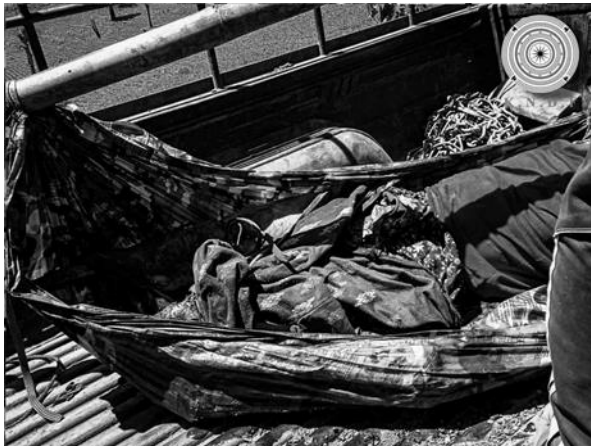
အမျိုးသမီးတစ်ဦး စကစ မိုင်းနင်းမိသေဆုံး ဖရူဆိုမြို့နယ်