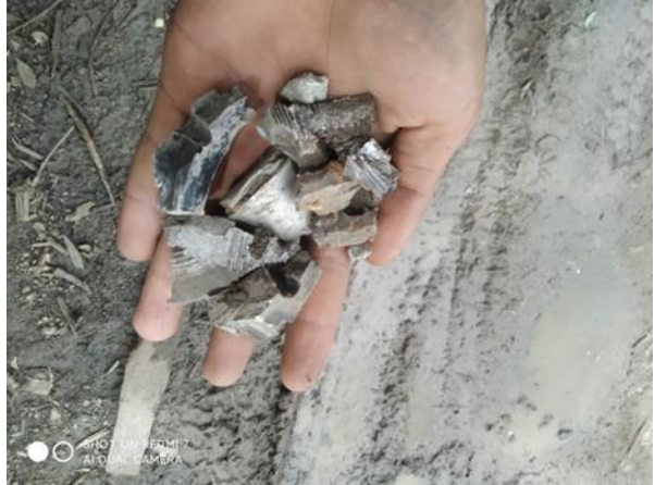
စကစ လက်နက်ကြီးပစ်ခတ်သည့် အပိုင်းအစ၊ ဒီးမော့ဆိုမြို့နယ်

စက်တင်ဘာလ ၁၉ရက်၊ လွိုင်ကော်မြို့နယ်အရှေ့ဘက်ရှိ ကြတ်ဂူအနီးတစ်ဝိုက်ကို တိုက်ပွဲဖြစ်ပွားခြင်းမရှိဘဲ စစ်ကောင်စီတပ်မှ နံနက် ၇ နာရီကျော်အချိန်တွင် ဗုံးကြဲတိုက်ခိုက်ခဲ့ပါသည်။ ထိုတရက်တည်းအတွင်း ည ၁၁ နာရီအချိန် ဖယ်ခုံမြို့နယ် အနောက်ဘက်ခြမ်း စစ်ဘေးရှောင်အနီးတစ်နေရာ စစ်ကောင်စီတပ်များမှ လေယာဉ်ဖြင့် ဗုံးကြဲတိုက်ခိုက်သွားခဲ့၍ စစ်ဘေးရှောင်ပြည်သူများ၏ တဲ့အချို့ထိမှန်ပျက်စီးသွားပြီး ထိခိုက် ဒဏ်ရာ ရရှိမှုအချို့လည်း ရှိသည်။ ထို့အပြင် လွိုင်ကော်- မိုးဗြဲကြားရှိ ကုန်းသာရွာနှင့် ဆင်စခန်း အနောက်ဘက် IDP စခန်းတို့တွင် စစ်ကောင်စီတပ်မှ ဗုံးကြဲခဲ့ပါသည်။ ထိုတရက်တည်းတွင် ဖရူဆိုမြို့နယ်၊ ဒေါပိုရှေးကျေးရွာတွင် ကရင်နီပူးပေါင်းတပ်ဖွဲ့များနှင့် စစ်ကောင်စီတို့ တိုက်ပွဲဖြစ်ပွားခဲ့ပြီး ကရင်နီပူးပေါင်းတပ်မှ ရဲဘော် ၉ ဦးထိခိုက်ဒဏ်ရာ ရရှိသွားခဲ့သည်။