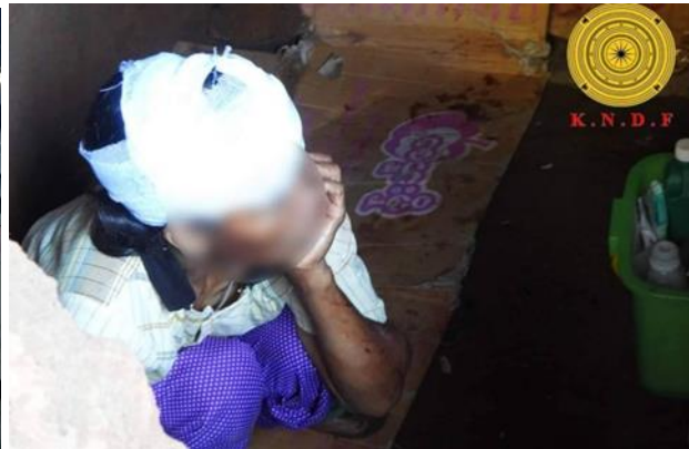
စကစ လက်နက်ကြီးကြောင့် ပျက်စီးသွားသော အိမ်၊ ဖရူဆိုမြို့နယ် စကစ လက်နက်ကြီးကြောင့် အမျိုးသမီးတစ်ဦး ထိခိုက်ဒဏ်ရာရရှိ၊ ဖရူဆိုမြို့နယ်