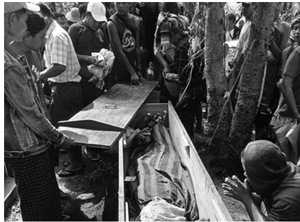
၈ကစ ရိုက်နက်မှုကြောင့် အမျိုးသားတစ်ဦးသေဆုံး

အောက်တိုဘာလ ၁၅ ရက်၊ ည ၇ နာရီအချိန်တွင် ဒီးမော့ဆိုအနောက်ခြမ်း စစ်ဘေးရှောင်များရှိသည့် ကျေးရွာများအား စစ်ကောင်စီတပ်များမှ လက်နက်ကြီး ၇ လုံးဖြင့် ပစ်ခတ်ခဲ့သည်။