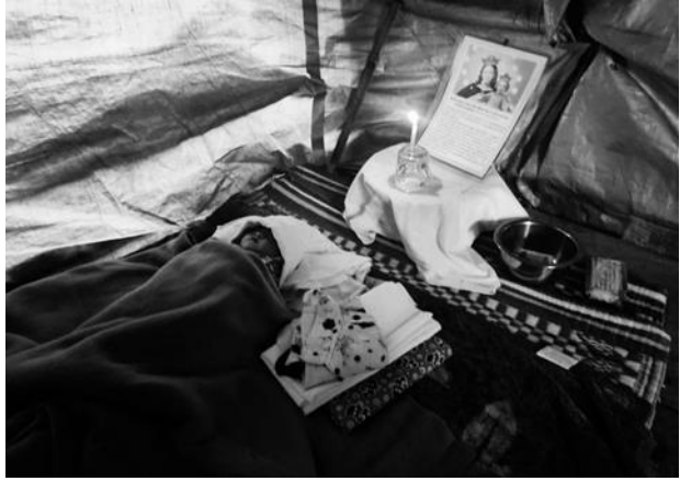
၈ကစ လက်နက်ကြီးပစ်ခတ်မှုကြောင့် ၇ ရက်သားကလေးငယ်သေဆုံး