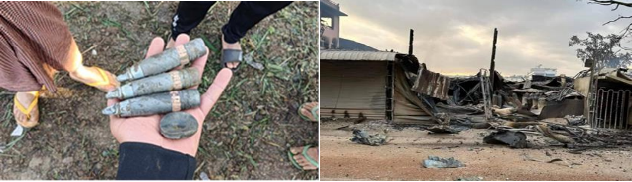
ဒီးမော့ဆိုအနောက်ဘက်ခြမ်းအား စကစမှ လေကြောင်းဖြင့် ဖုံးကြဲတိုက်ခိုက် စကစ၏ လက်နက်ကြီးပစ်ခတ်မှုကြောင့် ပျက်စီးသွားသော အဆောက်အဦး၊ လွိုင်ကော်မြို့

ဒီဇင်ဘာလ ၁၄ရက်၊ လွိုင်ကော်မြို့၊ ဘာဒိုရပ်ကွက်ဖက်သို့ တိုက်ပွဲဖြစ်ပွားခြင်းမရှိဘဲ စစ်ကောင်စီတပ်မှ လေယာဉ်ဖြင့် လေးကြိမ်လာရောက်ဖုံးကြဲခဲ့ပါသည်။ ဖုံးကြဲတိုက်ခိုက်ခြင်းကြောင့် ပြည်သူ့နေအိမ် အချို့ ထိခိုက်ပျက်စီးမှုများ ရှိသည်။