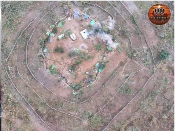
သိမ်းပိုက်ခံရသည့် စကစ တပ်စခန်း၊ ဖယ်ခုံမြို့နယ်

ထိုခရစ္စမတ်နေ့အတွင်း ဖယ်ခုံမြို့နယ်အတွင်းရှိ စစ်ကောင်စီ၏ တပ်စခန်း နှစ်ခုဖြစ်သည့် ရွှေပြည်အေးနှင့် လွယ်ပတာ စခန်းကုန်းတို့ကို တော်လှန်ရေးပူးပေါင်းတပ်တို့မှ ဒီဇင်ဘာလ ၂၃ရက်နေ့မှ ၂၅ရက်နေ့အထိ ၃ရက်အတွင်း တိုက်ခိုက်သိမ်းပိုက်နိုင်ခဲ့ပြီး မြို့အဝင်အထွက်ကိုလည်း တော်လှန်ရေးတပ်ဖွဲ့များမှ ထိန်းချုပ်နိုင်ခဲ့ပါသည်။