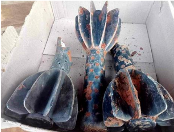
စကစမှ လွိုင်ကော်မြို့နယ်အား လက်နက်ကြီးများဖြင့် ပစ်ခတ်