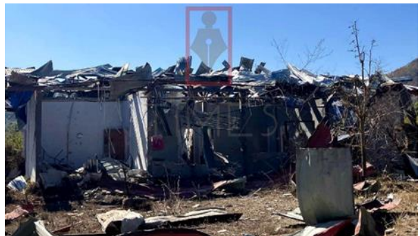
ကရင်နီပူးပေါင်းတပ်ဖွဲ့များမှ ဖယ်ခုံမြို့ ရဲစခန်းအား သိမ်းပိုက် ဒေါတမငယ်ရပ်ကွက်မှ လေကြောင်းဖြင့် ဗုံးကြဲတိုက်ခိုက်ခံရ၊ ဒီးမော့ဆို

ဇွန်ဝါရီလ ၉ရက်၊ ၂၀၂၄ ခုနှစ်၊ ဖယ်ခုံမြို့နယ်အတွင်း ကရင်နီပူးပေါင်းတပ်ဖွဲ့များနှင့် စစ်ကောင်စီတို့အကြား တိုက်ပွဲပြင်းထန်ခဲ့ပြီး တိုက်ပွဲအတွင်း ပိတ်မိပြည်သူများအား စက်လှေဖြင့် လာရောက်ကယ်ထုတ်ချိန်တွင် စစ်ကောင်စီတပ်မှ စက်သေနတ်များဖြင့် ပစ်ခတ်ခဲ့သည်။ ပစ်ခတ်မှုအတွင်း ပြည်သူတစ်စုံတစ်ရာ ထိခိုက်မှုမရှိဘဲ စက်လှေနှစ်စီးသာ အနည်းငယ် ထိခိုက်ပျက်စီးခဲ့ပါသည်။