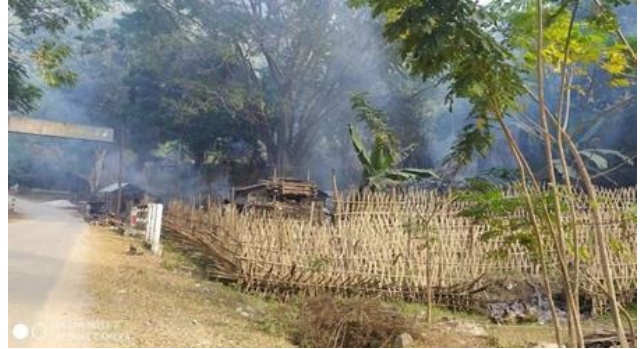
စကစဒရုန်းဖြင့် မီးလောင်ပုံးများနှင့် တိုက်ခိုက်၊ လျှင်ကော်မြို့၊ မော်ချီးရှိ စကစ တပ်စခန်းအား ကရင်နီပူးပေါင်းတပ်ဖွဲ့များမှ မီးရှို့ ဖျက်ဆီး

ဇန်နဝါရီလ ၂၅ ရက်၊ စစ်ကောင်စီတပ်များမှ ဒရုန်းများအသုံးပြုပြီး လျှင်ကော်မြို့အား မီးလောင်ပုံးများဖြင့် ကြံချသည့်အတွက် လျှင်ကော်မြို့ ဈေးပိုင်းရပ်ကွက်ရှိ နှစ်ထပ်ဈေးနှင့် အနီးတဝိုက်ရှိဈေးဆိုင်အား မီးလောင်ပျက်စီးသွားခဲ့သည်။