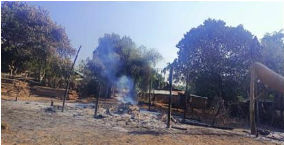
စကစလေကြောင်းတိုက်ခိုက်မှုကြောင့် မီးလောင်ပျက်စီးသွားသော အိမ်များ ရှားတောမြို့

ဖေဖော်ဝါရီလ ၄ ရက်၊ မိုင်းပြင်းမြို့နယ်အခြေစိုက် စစ်ကောင်စီတပ် ခလရ ၂၄၉ တပ်ရင်းမှ ရှားတောမြို့နယ်အတွင်း စစ်ရဟတ်ယာဉ် သုံးစင်းဖြင့် စစ်ကူလာပို့ကာ စစ်ကြောင်းထိုးလာပြီး စစ်ဘေးရှောင်နေသော အမျိုးသားတစ်ဦးနှင့် ကိုယ်ဝန်ဆောင်မိခင်တစ်ဦး အပါအဝင် မသန်စွမ်းအမျိုးသမီးသုံးဦး ကလေး ၃ ဦးအပါအဝင် ၇ ဦးအား ဓားစာခံအဖြစ် ဖမ်းဆီးခေါ်သွားခဲ့ပြီး နောက်တစ်ရက် နံနက်အချိန်တွင် ပစ်သတ်သွားခဲ့သည်။ ထိုတရက်အတွင်း အရပ်သား ၇ ဦးအားသတ်ဖြတ်ခဲ့သော စစ်ကောင်စီတပ်များနှင့် ကရင်နီပူးပေါင်းတပ်များနှင့် တိုက်ပွဲဖြစ်ပွားကာ စစ်ကောင်စီတပ်သား ၄၀ ဦးသေဆုံးသွားခဲ့သည်။ တိုက်ပွဲဖြစ်ပွားနေသော နေရာသို့ စစ်ကောင်စီတပ်မှ လေကြောင်းဖြင့်လည်း ပစ်ကူတိုက်ခိုက်ခဲ့သည်။ ထို့အပြင် ရှားတောမြို့အား စစ်ကောင်စီမှ လေကြောင်းဖြင့် ဗုံးကြဲတိုက်ခိုက်မှုများကြောင့် လူနေအိမ် ၄၀ ကျော် ထိမှန် ပျက်စီးသွားခဲ့သည်။