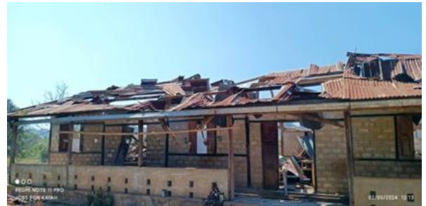
စကစ လေကြောင်းတိုက်ခိုက်ခဲ့သည့် ဒီးမော့ဆိုမြို့နယ်မှ စာသင်ကျောင်း