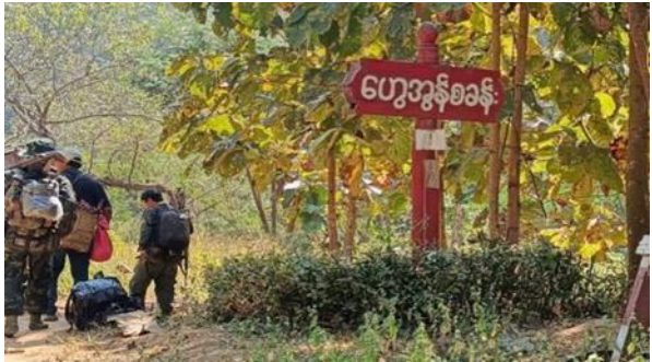
ရှားတောမြို့နယ်အတွင်းရှိ စကစ တပ်စခန်း ၂ ခု တပ်မှ ဆုတ်ခွါ

ဖေဖော်ဝါရီလ ၁၄ ရက်၊ ဒီးမော့ဆို-မော်ချီး-မယ်စွဲ ယာဉ်လိုင်းအား ကရင်နီပြည်နယ် ကြားကာလ ပြည်သူ့အုပ်ချုပ်ရေးကောင်စီမှ စတင်ပြေးဆွဲနေပြီဖြစ်ပြီး တစ်ပတ်လျှင် ၄ ရက်ဖြင့် ပြေးဆွဲမည်ဖြစ်သည်။