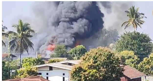
စကစမှ လွိုင်ကော်မြို့အား စီးလောင်ခုံးများဖြင့် တိုက်ခိုက်

ဖေဖော်ဝါရီလ ၁၃ ရက်၊ နေ့လည် ၂ နာရီ ၃၀ မိနစ်အချိန်တွင် တိုက်ပွဲဖြစ်ပွားခြင်းမရှိဘဲ ဖယ်ခုံအခြေစိုက် စစ်ကောင်စီတပ်သည် ဖယ်ခုံမြို့နယ်၊ ရွှေစမ်းကျေးရွာအား လက်နက်ကြီးများဖြင့် ရမ်းသမ်းပစ်ခတ်သည့်အတွက် အသက် ၁၇ နှစ်အရွယ်ရှိ စစ်ဘေးရှောင် ကျောင်းသူတစ်ဦးအပါအဝင် အသက် ၃၀ နှစ်နှင့် အသက် ၅၀ အရွယ်ရှိ ဒေသခံ အမျိုးသမီး ၃ ဦး ထိမှန်သေဆုံးသွားခဲ့သည်။ ထိုတစ်ရက်အတွင်း ကရင်နီပြည်၊ ရှားတောမြို့နယ်မှ သံလွင်အရှေ့ဘက်ကမ်းတွင် ရှိသော စစ်ကောင်စီတပ်စခန်းနှစ်ခုဖြစ်သည့် ခမရ ၁၃၅ နှင့် ၅၄ တပ်စခန်းများအား စစ်ရဟတ်ယာဉ်ဖြင့် လေးကြိမ် လာရောက်ခေါ်ဆောင်သွားခဲ့ပြီး ၎င်းတပ်မှ ဆုတ်ခွါသွားခဲ့သည်။