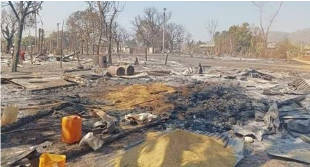
တောမီးကြောင့် အရပ်သားအိမ်များ မီးလောင်ပျက်စီး၊ လွိုင်ကော်မြို့နယ်

မတ်လ ၆ ရက်၊ မြို့ပြမြို့နယ်တွင် တောင်ယာခင်းထဲမှ နေအိမ်ပြန်လာသော အသက် ၄၈ နှစ်အရွယ်အမျိုးသား တစ်ဦးအား စစ်ကောင်စီထောင်ထားသော မြေမြှုပ်နှံရေးမိကာ ဘယ်ဘက်လက်နှင့် ခြေထောက်များတွင် ထိခိုက်ဒဏ်ရာ ရရှိသွားခဲ့သည်။