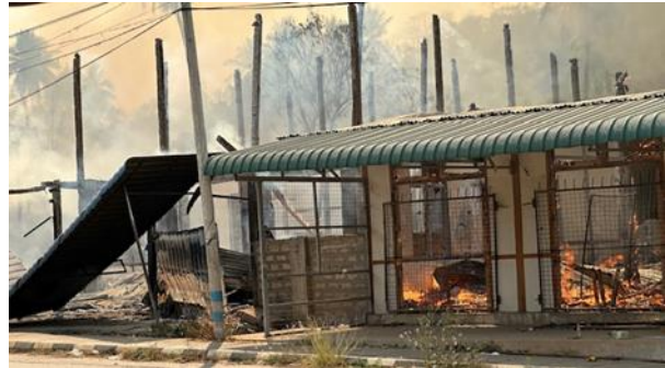
စကစလေကြောင်းတိုက်ခိုက်မှုမှ ပျက်စီးသွားဖားဆောင်းမြို့

မတ်လ ၄ ရက်၊ ဖရူဆိုမြို့တွင် ထော်လော်ဂျီးသုံးစီးဖြင့် နေအိမ်ပြည်လည်ကြည့်သော အရပ်သားများအား စစ်ကောင်စီတပ် ၁၆၇၂၁ မှ လက်နက်ကြီးများဖြင့် ပစ်ခတ်ခဲ့သည်။