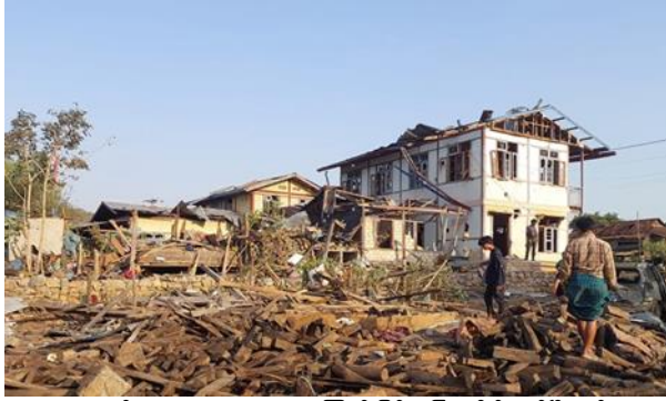
စကစမှ ကုန်းသာကျေးရွာအား လေကြောင်းဖြင့် ဗုံးကြဲ၊ လှိုင်ကော်မြို့နယ်