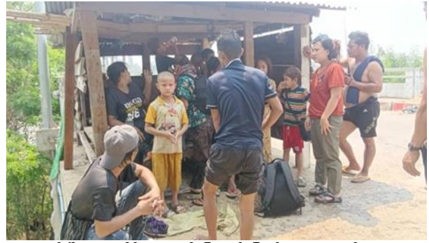
ဖားဆောင်းမြို့၊ စကစထိန်းထံမှ ထွက်ပြေးလွတ်မြောက်လာသော အရပ်သားများ

ဧပြီ ၂၉ ရက်၊ ဖားဆောင်းမြို့တွင် စစ်ကောင်စီတပ်များ၏ ဓားစာခံအဖြစ် ဖမ်းဆီးထိန်းသိမ်းခံရသော အရပ်သား ၁၈ ဦး ထွက်ပြေးလွတ်မြောက်လာခဲ့သည်။ ထိုထွက်ပြေးလွတ်မြောက်လာသော မြို့ခံအရပ်သားများတွင် ကိုယ်ဝန်သည်အမျိုးသမီးများအပြင် ကလေးငယ်များလည်း ပါဝင်သည်။