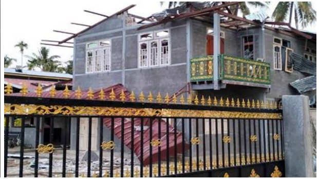
စကစ ရဟတ်ယာဉ်အား ကရင်နီပူးပေါင်းတပ်ဖွဲ့များမှ ပစ်ချ၊ ဘောလခဲမြို့နယ် လင်ဖိုကြီးကျေးရွာ စကစ လက်နက်ကြီးပစ်ခတ်မှုကြောင့် နေအိမ်ပျက်စီး၊ လွိုင်ကော်မြို့နယ်

မေလ ၁၄ ရက်၊ လွိုင်ကော်မြို့နယ် နွားလပိုးကျေးရွာအနီးတွင်ရှိသော ခလရ ၂၆၁ တပ်ရင်း အင်အား ၆၀ မှ ၁၀၀ အကြားမှ စစ်ကောင်စီတပ်သည် ထေးပလော်ခူကျေးရွာနှင့် လင်ဖိုလေးကျေးရွာအကြားသို့ စစ်ကြောင်း ထိုးလာသည်။ စစ်ကြောင်းထိုးလာသည့် အတွက် ပြည်သူများ သတိထားနေထိုင်ကြရန် ကရင်နီပူးပေါင်းဖွဲ့မှ သတိပေး ကြေညာခဲ့သည်။